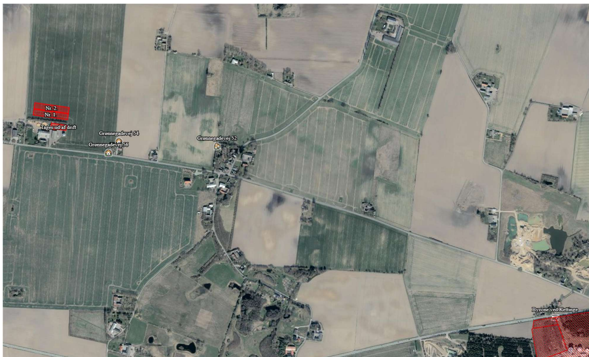
Figur 1. Beliggenhed i forhold til nabobeboelser, byzone og samlet bebyggelse.

Nedenstående figur 1 viser et kort med placering af nabobeboelser, byzone og samlet bebyggelse i forhold til husdyrbrugets anlæg.