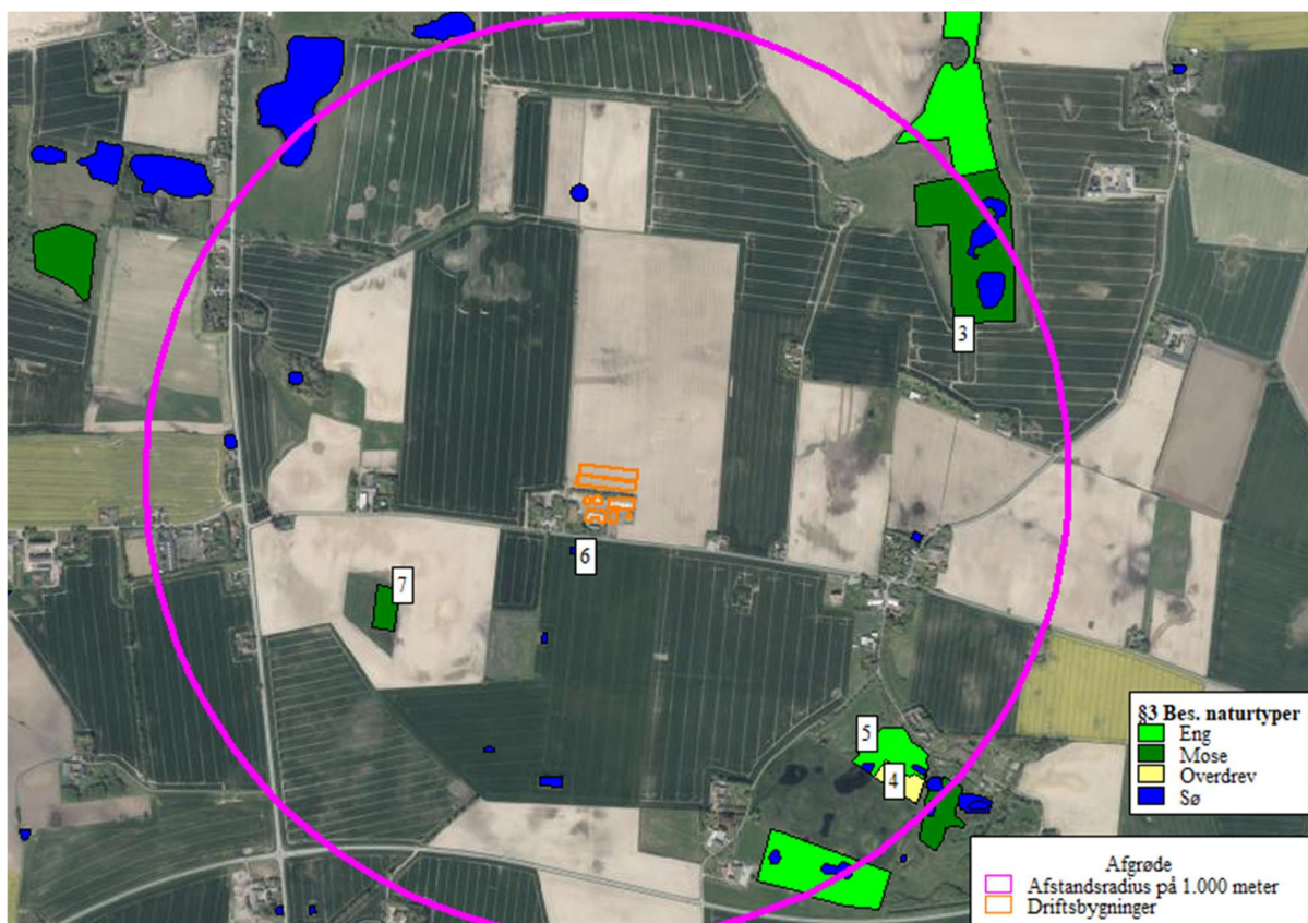
Figur 3. Beskyttede naturområder i lokalområdet. Afstanden til kategori 1- og 2- naturområderne er så stor, at de ikke er vist på figuren.

På figur 3 nedenfor er der en oversigt over naturområder i lokalområdet.