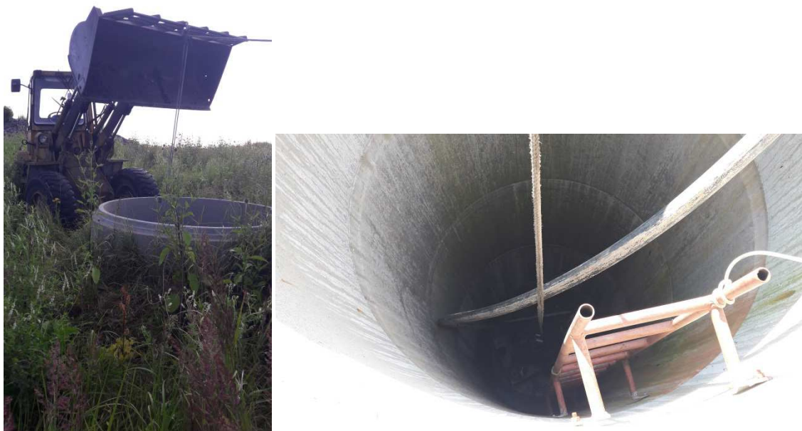
Foto 3 og 4. Ny pumpe er hejst ned i perkolatbrønden.