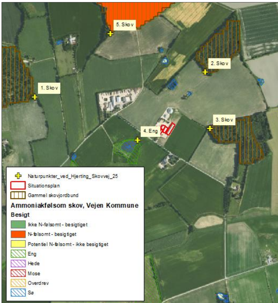
Figur 3. Kort over kategori 3 samt § 3 natur ved anlægget.