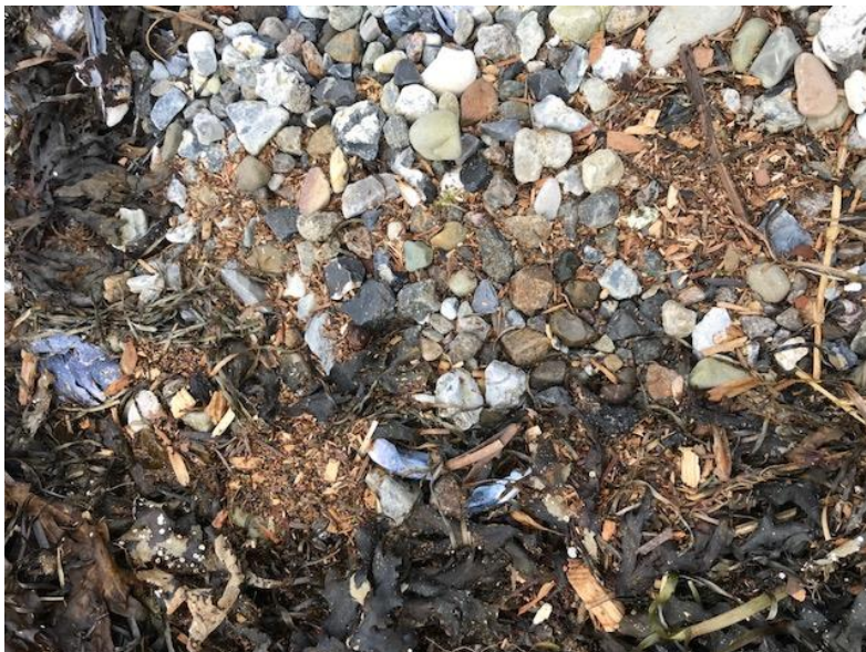
Billede 1: Borgehenvendelse om spild af flis

Borgerhenvendelsen skete søndag den 17. februar 2019 og var ledsaget af foto- og videodokumentation