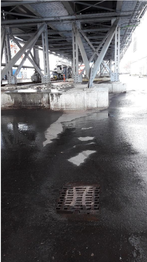
Billede 5: Areal under transportbånd