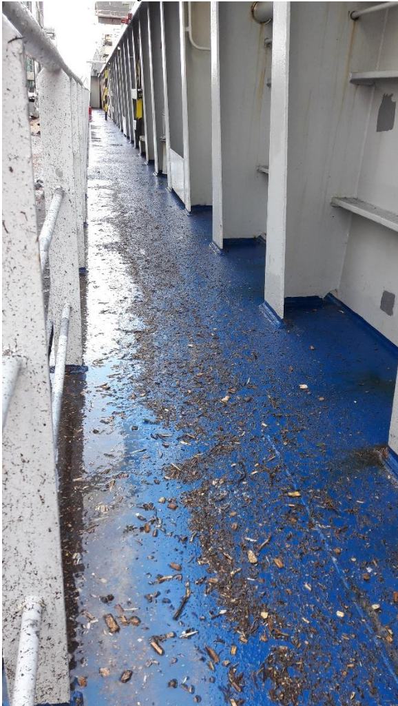
Billede 4: Tabt flis på skibets gangareal ved ræling

Ørsted A/S oplyste, at man fornyeligt har instrueret rederierne om ikke at spule eller feje flis af skibene under sejlads i nærheden af værket.