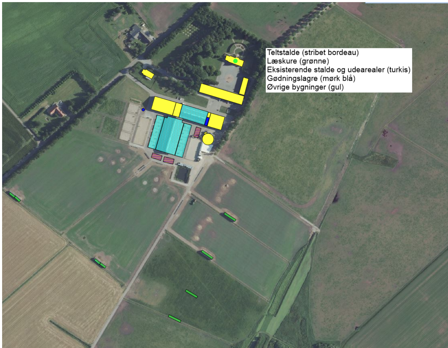
Kopi af figur 1- oversigtstegning