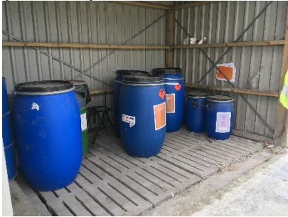
Opbevaring af flydende olie- og kemikalieaffald.