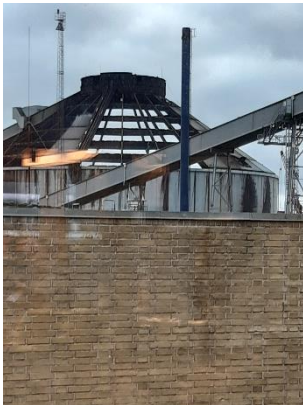
Træpillesiloen. Tagkonstruktionen er ved at blive pillet ned. Studstrupværket oplyste, at der er opsamlet ca. 7.500 m 3 slukningsvand fra branden. Vandet opbevares pt. i siloer på Aarhus havn, indtil en bortskaffelsesløsning findes. Vandet indeholder bl.a. høje niveauer af Zn og Cu, som formodes at stamme fra loftsbeklædning og kabler.