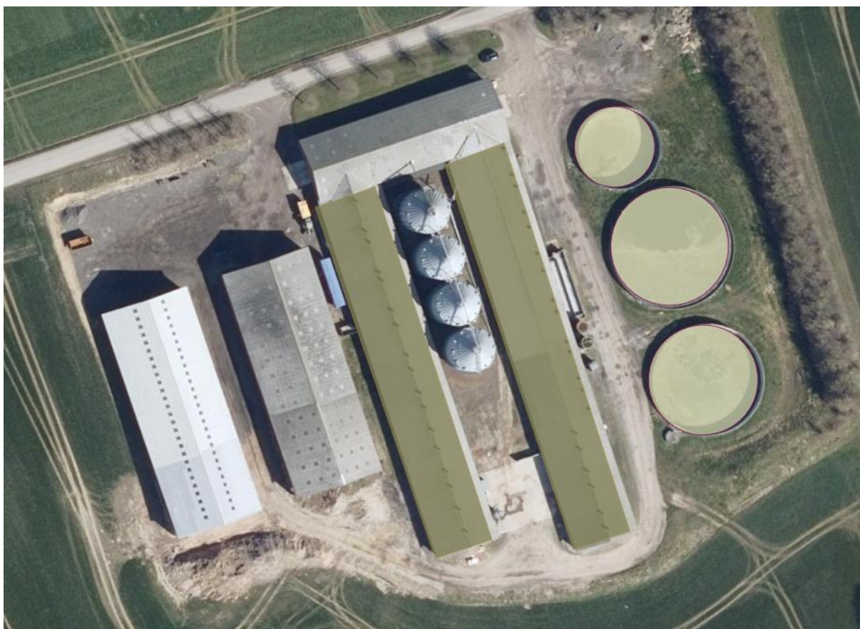
Figur 2-1 Stalde og gyllebeholdere er markeret. Luftfoto 2021.