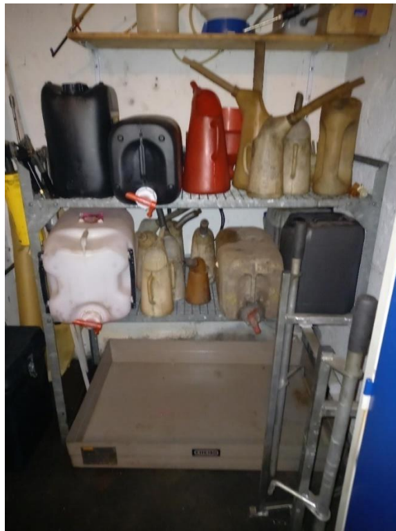
Billede 1: oplag af kølvæske med spildbakke under.

Hovedparten af autoværkstedets råvare opbevares i kemikalierummet, hvor belægning består af tæt beton. Der er ikke noget afløb i kemikalierummet