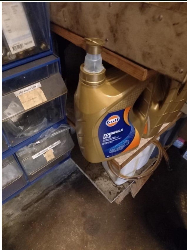
Billede 3: oplag af motorolie VW UP