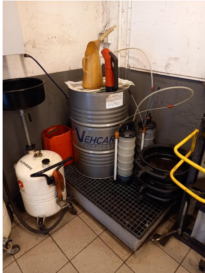
Billede 2: motorolie på spildbakke