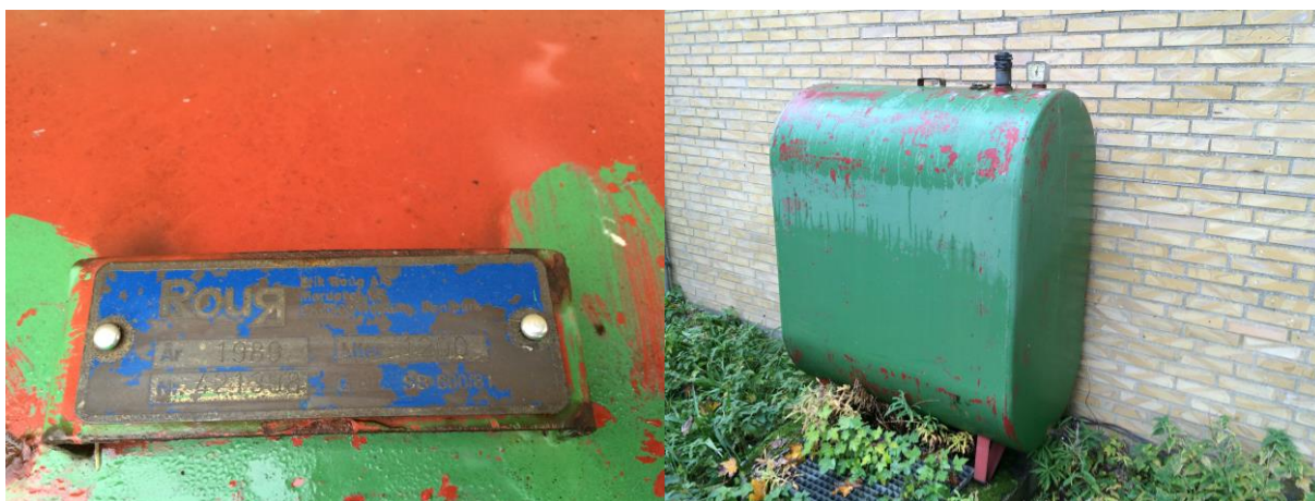
1200 liters fyringsolietank.

Den lovlige levetid for begge tanke afhænger af, om de er indvendigt korrosionsbeskyttet, men det antages at dette ikke er tilfældet, hvorved tankene har en lovlige levetid på 30 år fra produktionstidspunktet.