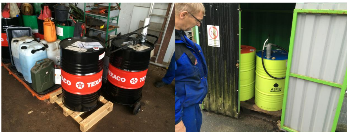
I baggrunden lovlig opbevaring på spildbakke. Tønder i forgrund skal også opbevares på spildbakke.