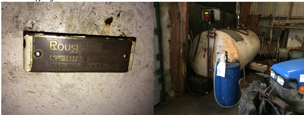
5900 liters dieseltank placeret indendørs i garage.