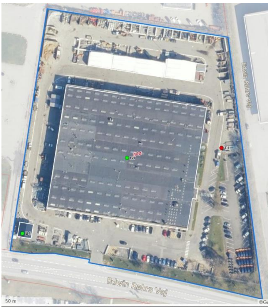
Luftfoto af virksomheden fra BBR med matrikelskel

I forhold til kommuneplanen ligger virksomheden i erhvervsområde 240102ER.