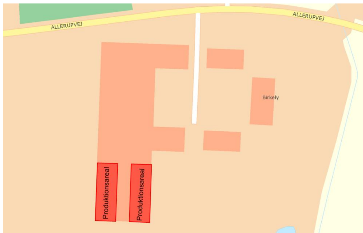
Figur 4.1. Oversigtskort over husdyrbrugets anlæg.

En oversigt over husdyrbrugets bygninger og andre anlæg fremgår af figur 4.1.