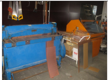
CNC-fræser og klippemaskine