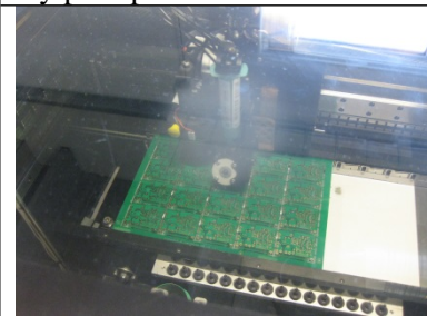
Pasta sættes på