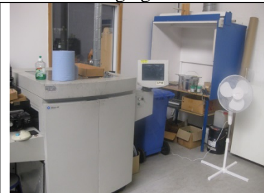
Autoklave og silketryk- pastamaskine