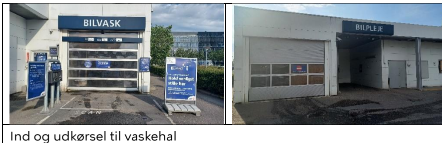
Ind og udkørsel til vaskehal

Der benyttes postevand, som blødgøres ved osmose. Sæbe tilsættes fra et automatisk doseringsanlæg. Spildevand opsamles, renses biologisk inden recirkulering og udledning til kloak.