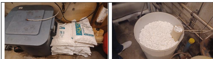
Tilsætning af salt til vaskevand inden vask

Som alternativ til osmose benyttes et anlæg, hvor der tilsættes salt.