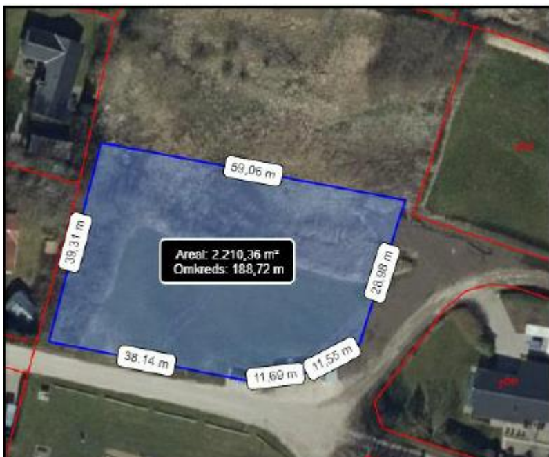
Figur 1, areal til mellemdeponi.

Arealet af mellemdeponiet fremgår af nedenstående figur 1.