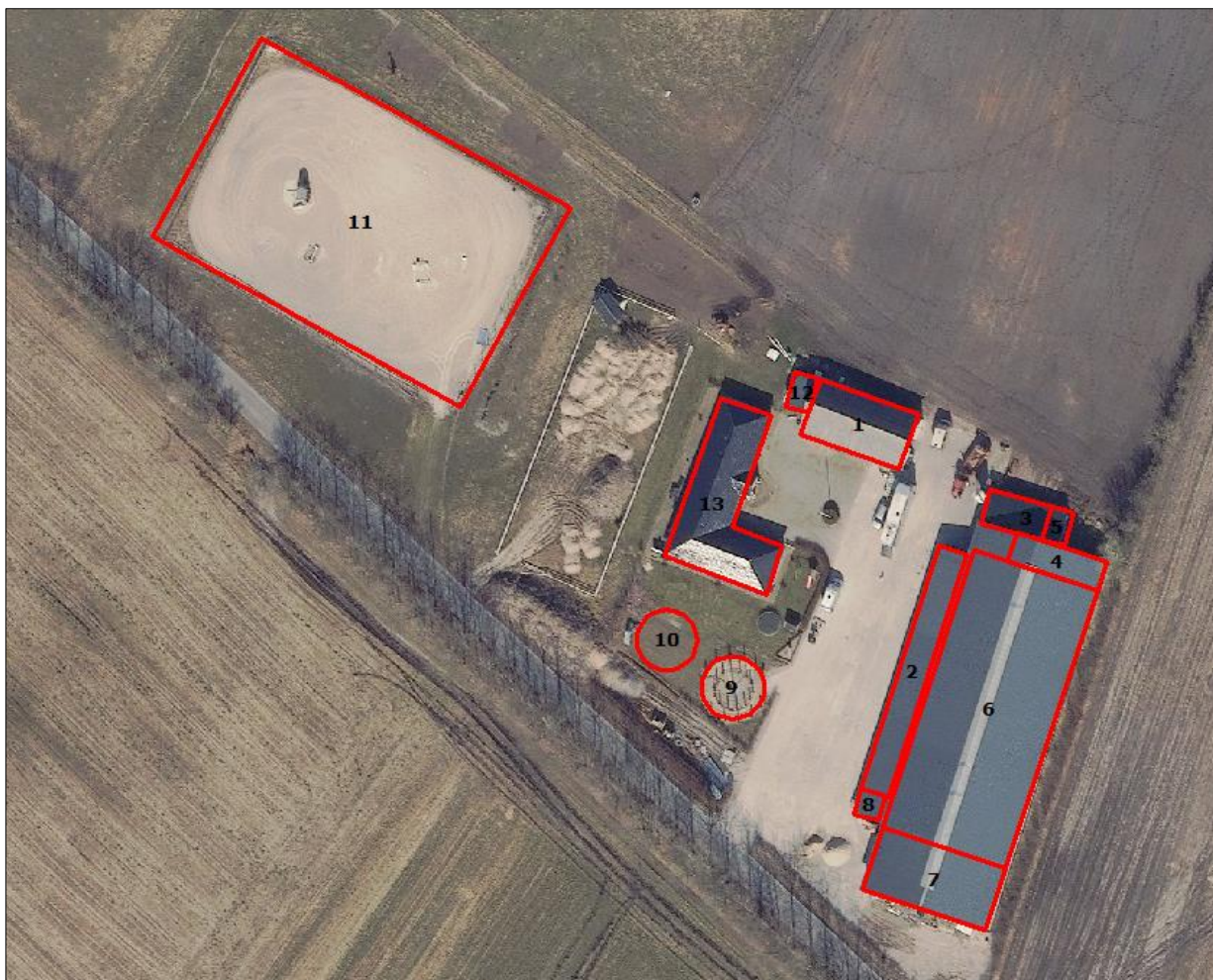
Figur 1. Husdyrbrugets driftsbygninger.