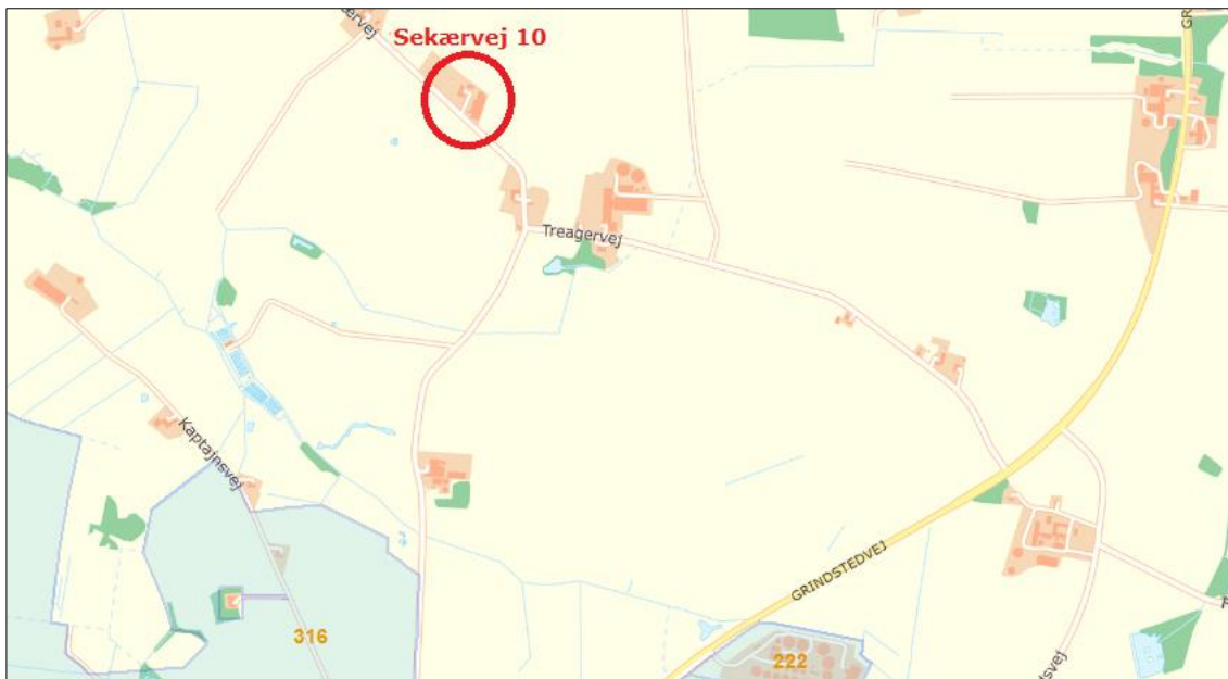
Figur 2. Husdyrbrugets placering ift. lokalplaner i området.

Vejen Kommune vurderer, at risikoen for forurening og væsentlige gener for omgivelserne er begrænset, da anlæggets placering i forhold til husdyrbruglovens genegrænser er overholdt.