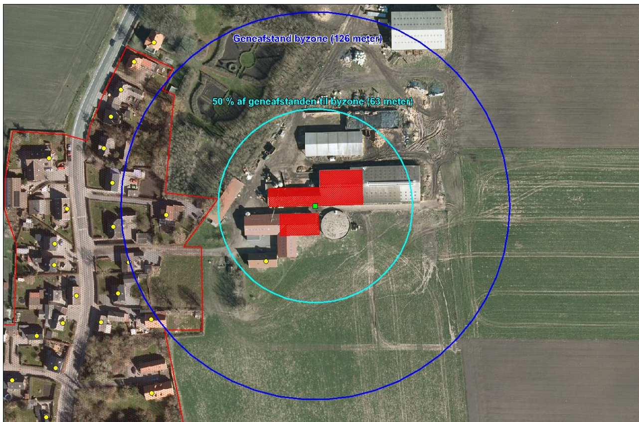
Figur 3: Illustrativ indtegning af anlæggets geneafstande til byzone og 50 % af denne. Geneafstandene er tegnet som buffere rundt om ejendommens lugtmidtpunkt. Nabobeboelser er angivet med gule cirkler. Genekriteriet til enkeltbolig og samlet bebyggelse på 40 og 41 meter er ikke indtegnet, da geneafstandene er mindre end de 63 meter der jf. kortet er til nærmeste genepunkt.