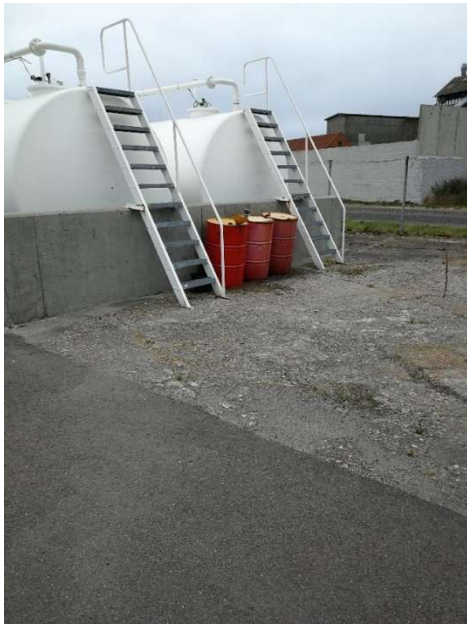
Tønder for enden af tankgården 2021