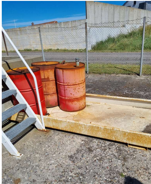
Placering af tønder på opsamlingskapacitet 2024

Spanden, der bruges til at fange spild ved tankningen, stod under påfyldningsstudserne ved tankgården.