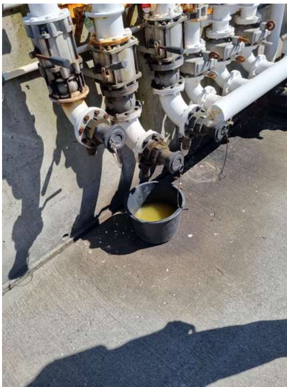
Spand til spild fra tankning

Der er fornuftigt at opsamle spild fra tankningen, men spanden til formålet skal tømmes efter tankning.