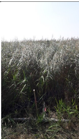
En af de 2 recirkuleringsledninger med første forstøver blandt tagrørene højt i den nordøstlige del af enhed A.