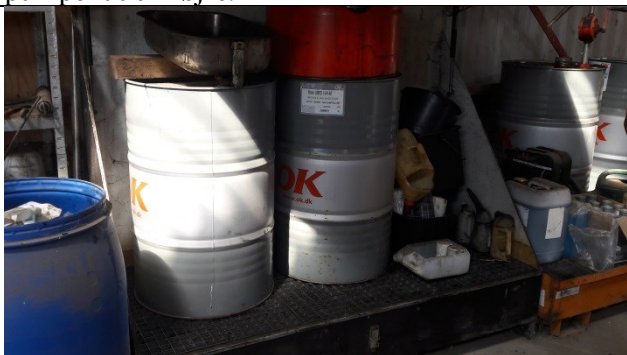
Olier mv. på spildbakker i garagen.