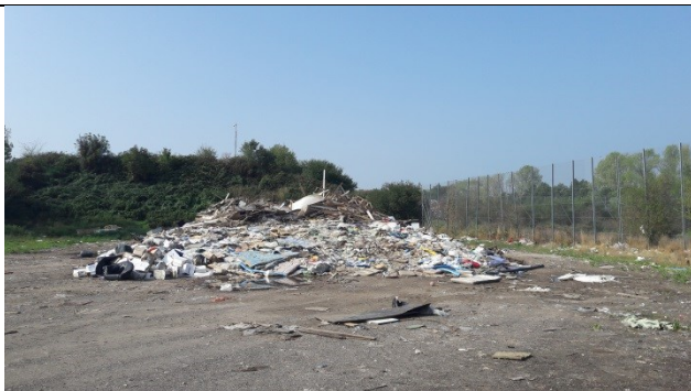
Stort brændbart afskærmet af hegn og volde på enhed A.