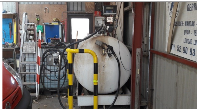
Olietank med spildbakke i garagen.