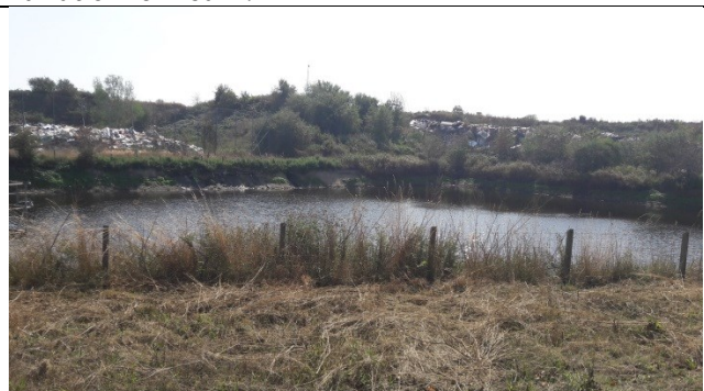
Perkolatbassinet med lidt lav vandstand på enhed A – til højre stort brændbart (forrige billede) og til venstre stort brændbart (næste billede).