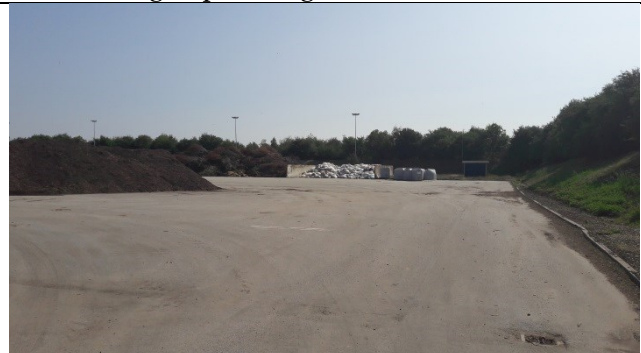
Sydlig og laveste del af komposteringspladsen med afløb til perkolatopsamling og pumpehus bagerst.