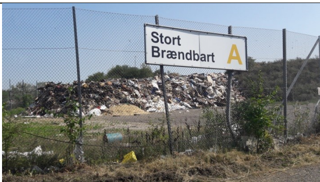
Indhegnet område til stort brændbart i mile på enhed A.