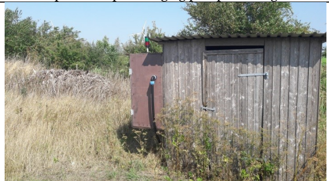
Gammel gasmotor i den nordlige del af enhed A. Der er nu udledning gennem biofilteret, der udskiftes 1 gang årligt.