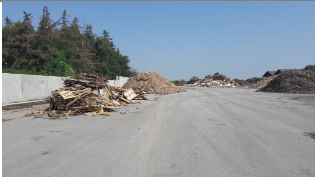
Mellemoplæg på komposteringspladsen mod nord.