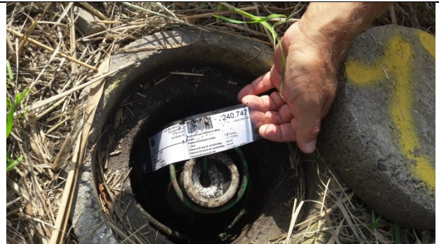
P2 - perkolatpejlebrønd