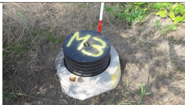
M3 – monitoringsbrønd opstrøms/nord for deponiet

Miljøstyrelsen konstaterede, at P2 og P4 delvist lever op til brøndborebekendtgørelsens krav, da de har beskyttelsesbrønd, er afsluttede med vandtæt lukning samt er markeret med DGU nr., filternummerering, kotemærke og fixpunkt. Boringerne er ikke aflåste, men de står inden for det aflåste hegn.