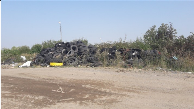
Mellemoplæg af dæk på enhed A.