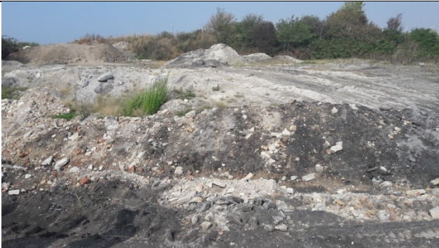
Deponeringsområde for aske på enhed A.