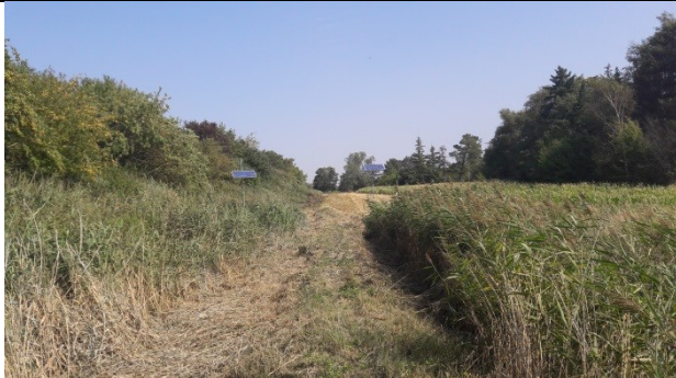
P3 ved solcellen til venstre (indenfor membran) og P4 ved solcellen til højre (udenfor membran). Solcellerne driver de automatiske pejle