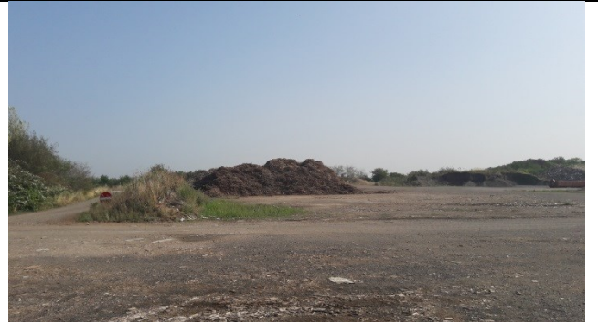
Mellemoplæg af biobrændsel på enhed A.