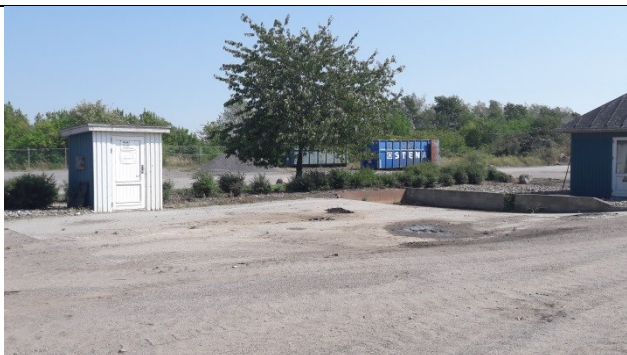
Vaskeplads med afløb til perkolatbassin og det blå pumpehus til højre.