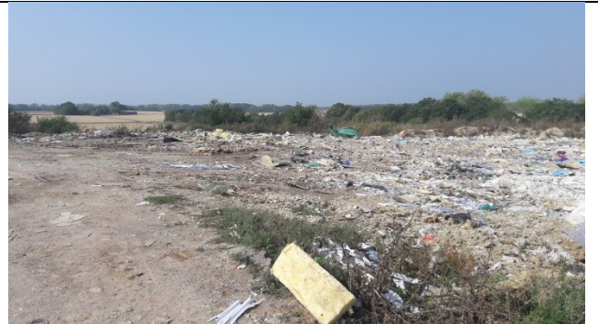
Tippen på enhed A.