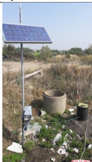
P5 – Solcellen driver det automatiske pejler