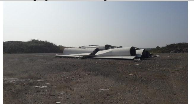
Mellemoplæg af gamle vindmøllevinger på enhed A.