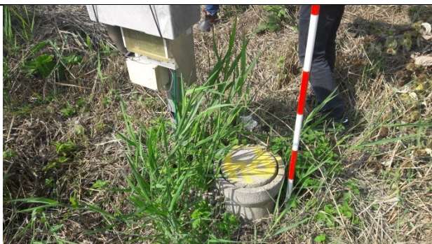
P4 - grundvandspejlebrønd