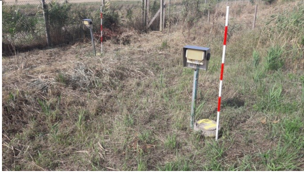
P1 til højre (indenfor membran) og P2 til venstre (udenfor membran)