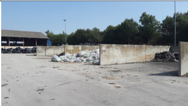
Båse på komposteringspladsen.