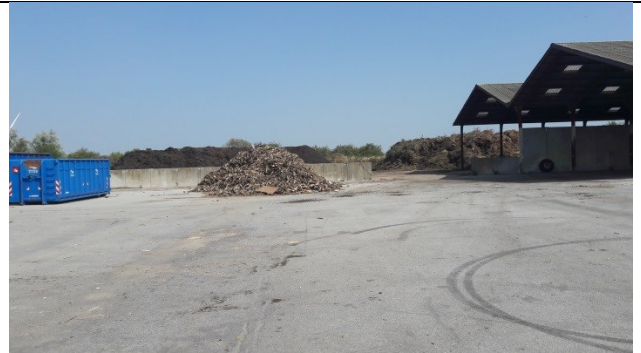
Nordlige del af komposteringsplads og den ubefæstede grenplads bagved.