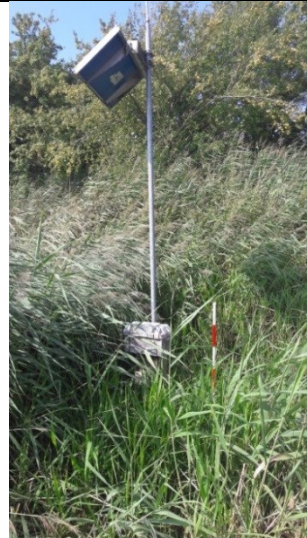
P3 - perkolatpejlebrønd. Skulle have samme opbygning som P4. Recirkuleret perkolat havde samlet sig på indersiden af den vertikale lermembran, hvilket forhindrede nærmere fotos