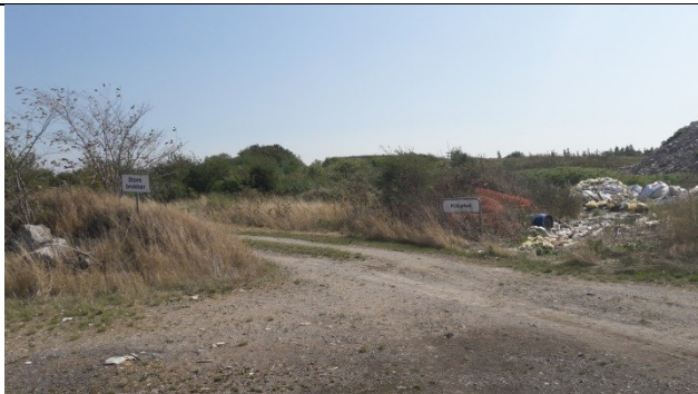
Celle for PCB-affald med signalnet. Bagerst det nordøstlige område af enhed A hvor der recirkuleres.