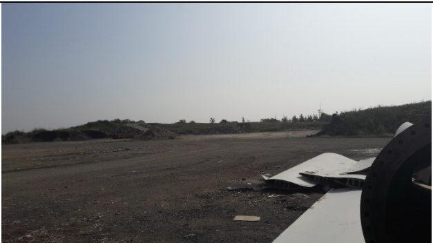
Mellemoplæg af tegl og brokker i baggrunden på enhed A.