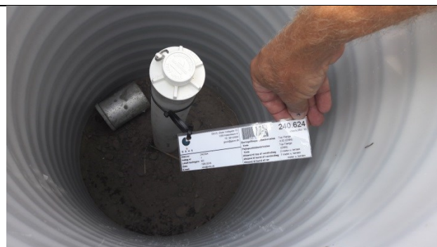
M3 – inden i beskyttelsesbrønden og med vandtæt lukning samt lås