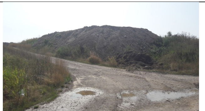
Mellemoplæg af ren jord syd for komposteringsplads.