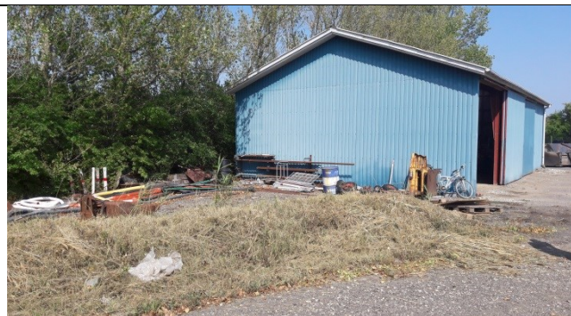
Garagen uden for den vertikale lermembran. Den lave vold er markeringen af den vertikale lermembran rundt om enhed A.