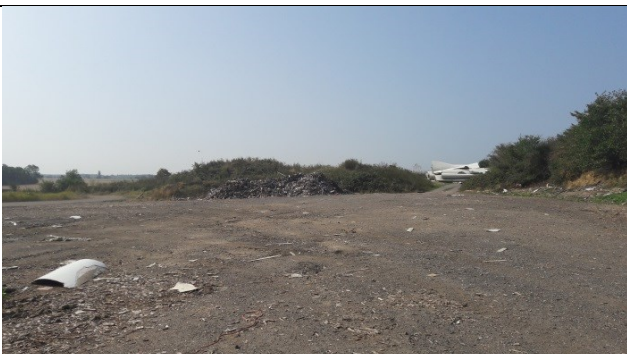
Mellemoplæg af metal og vindmøllevinger på enhed A.