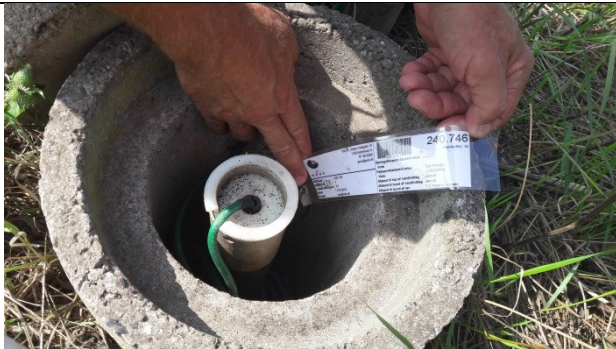
P1 - grundvandspejlebrønd