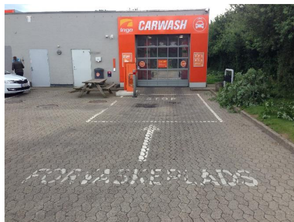
Forvask af biler