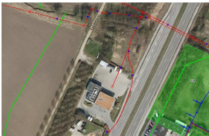
Kortudsnit af spildevandsplan for området

Virksomheden ligger i et område, der ifølge ledningsoplysninger fra Aarhus Vand kun er spildevandskloakeret, som det fremgår af den røde streg/ledning på nedenstående kortudsnit. Der er nedsivning af regnvand. Spildevand fra vaskehallen afledes til spildevandsledningen via sandfang og olieudskiller i henhold til spildevandstilladelse af 11. november 1998. Overfladevand fra salgsanlægget afledes via særskilt olieudskiller. Virksomheden er i 2015 blevet fritaget fra den kommunale tømningsordning for olieudskillere ved brug af selvvalgt entreprenør til opgaven.