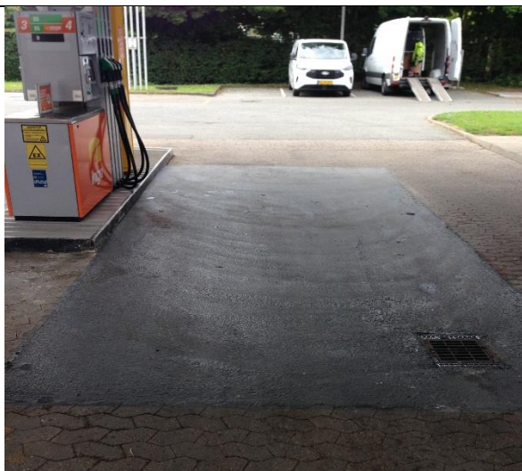
Salgsplads med afløb

Virksomheden har etableret nye tætte belægninger på både salgsplads og påfyldningsplads, som det fremgår af nedenstående fotos.