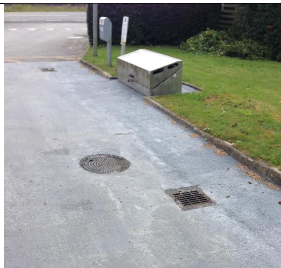
Påfyldningsplads med afløb