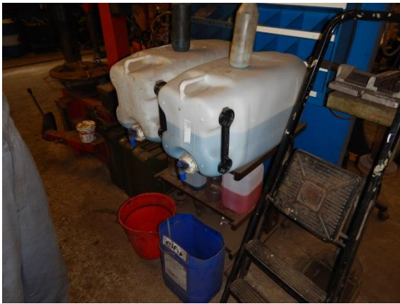
1. Opbevaring af køler- og sprinklervæske.