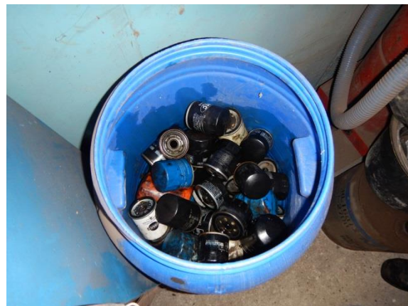
6. Spand til oliefiltere.