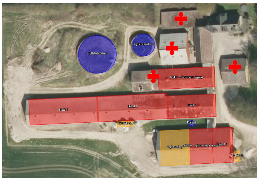
Figur 1. Staldafsnit og opbevaringsanlæg på Søndergårdevej 45. Bygninger markeret med rødt minus er fjernet i 2018.

Der søges om miljøtilladelse til det eksisterende produktionsareal.