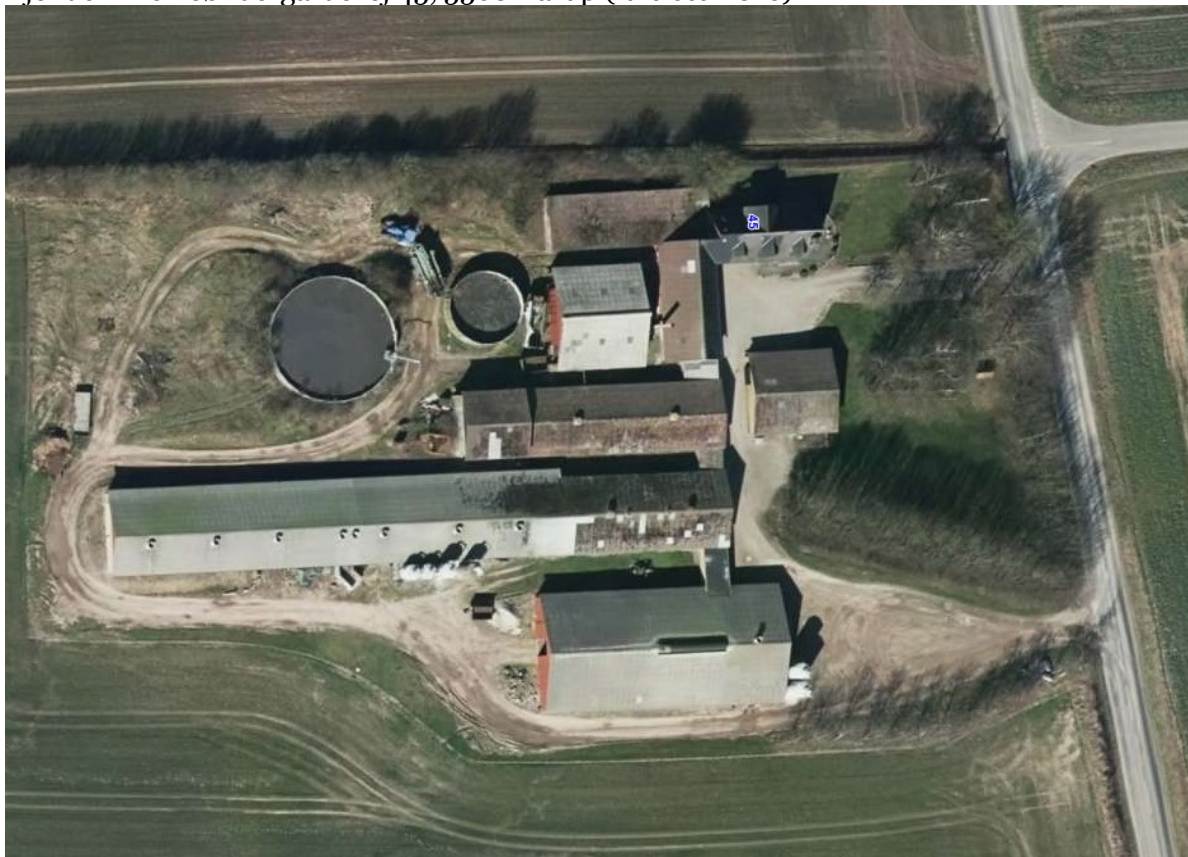
Ejendommen Søndergårdevej 45, 5560 Aarup (luftfoto 2016)