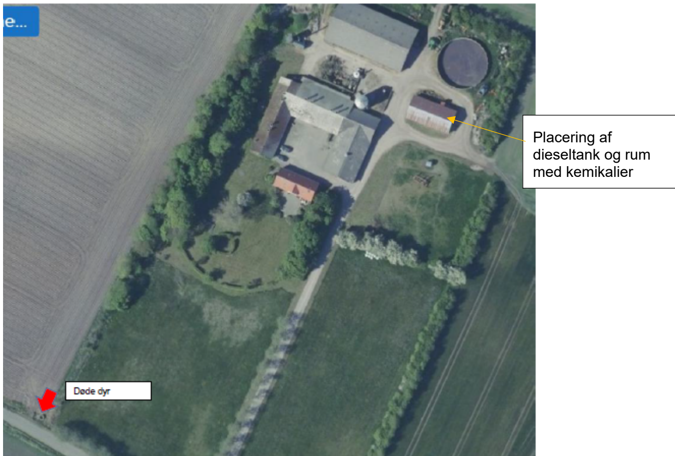
Figur 5 - tegning af miljørelevante forhold