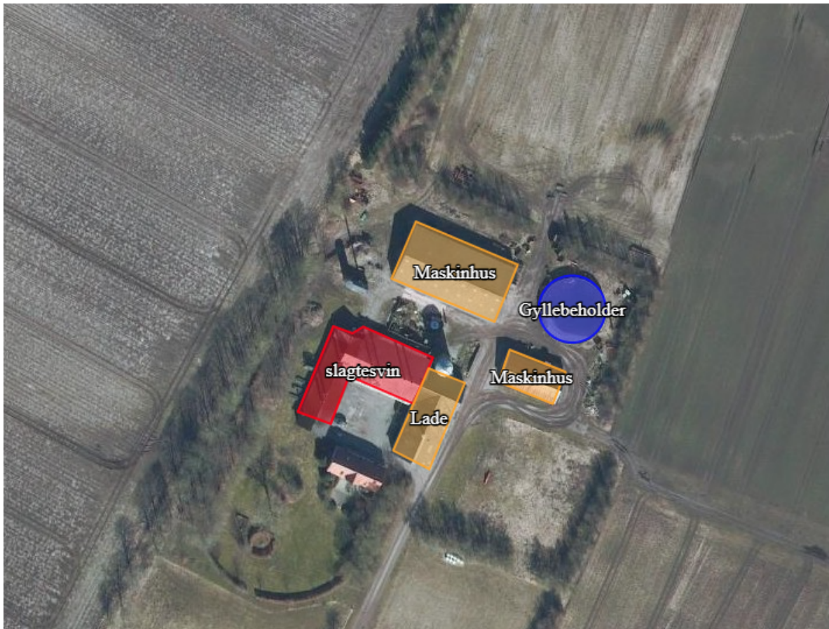
Figur 1 - oversigtskort af ejendommen

Husdyrbrugets husdyranlæg, øvrige bygninger og tekniske anlæg fremgår af tabel 2: