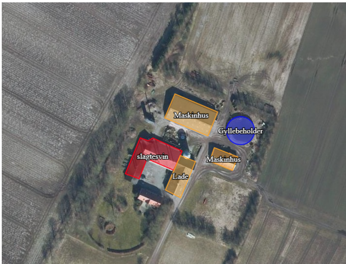
Kopi af Figur 1 - oversigtskort af ejendommen