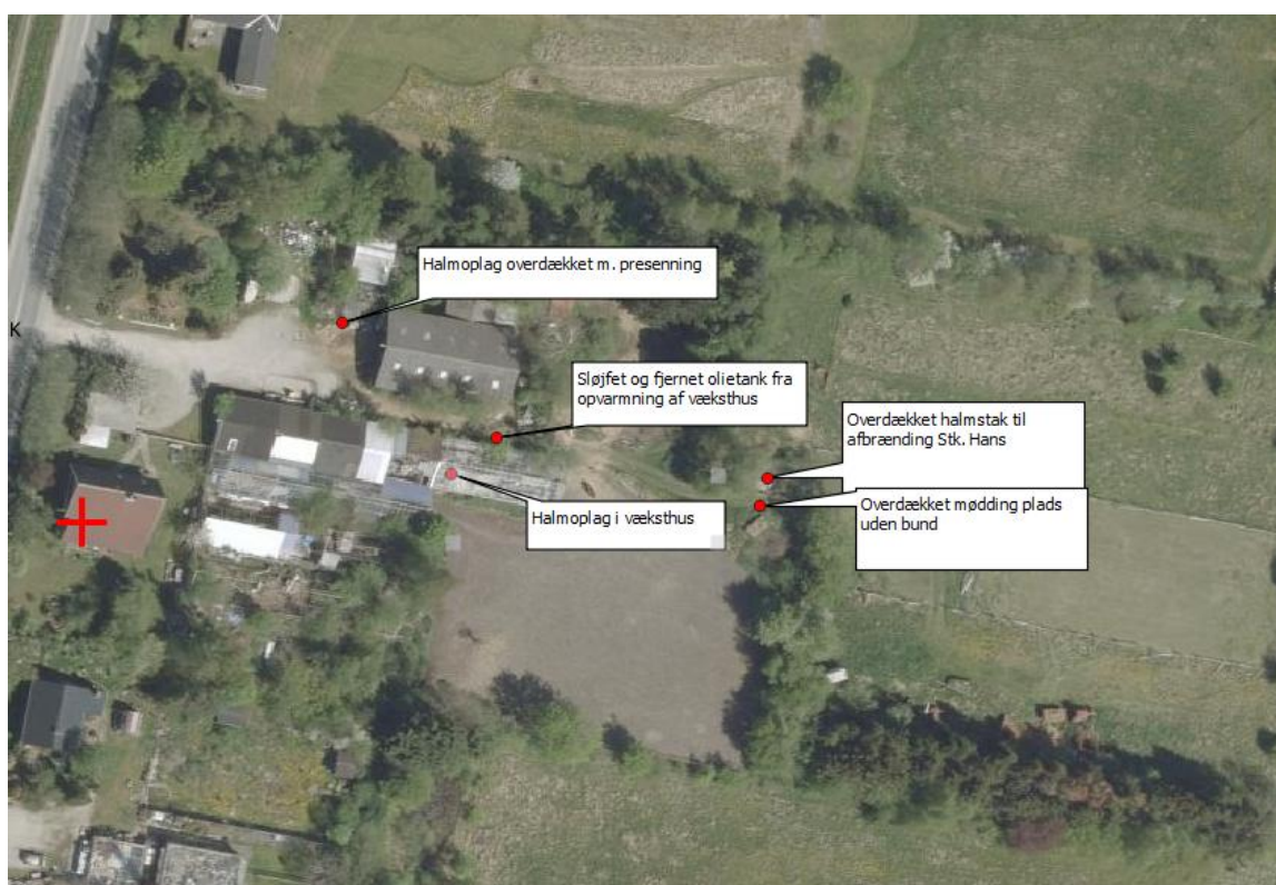
Figur 1: Oversigt over miljøforhold ved tilsynet.

Ejendommen har meget lidt affald i forbindelse med hobbyholdet. Eventuelle medicinrester afleveres hos dyrelægen.