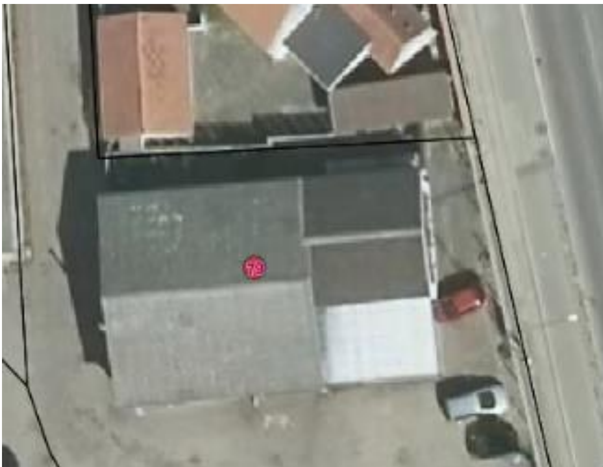
Luftfoto af ejendommen med matrikelskel anno 2019

I forhold til kommuneplanen ligger virksomheden i erhvervsområde 160513ER. Der ligger enkelte boliger i området, og virksomheden ligger mindre end 100 meter fra nærmeste bolig.