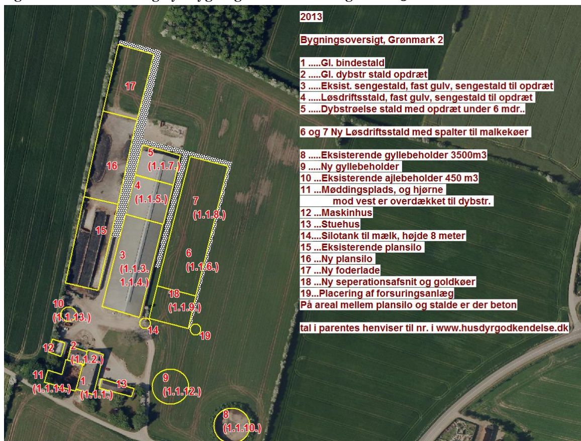
Figur 2: Eksisterende og nye bygninger – anmeldt august 2013

Sønderborg Kommune har d. 8. oktober 2013 truffet afgørelse om, at ændringen i bygningsmassen ikke er en godkendelsespligtig ændring.