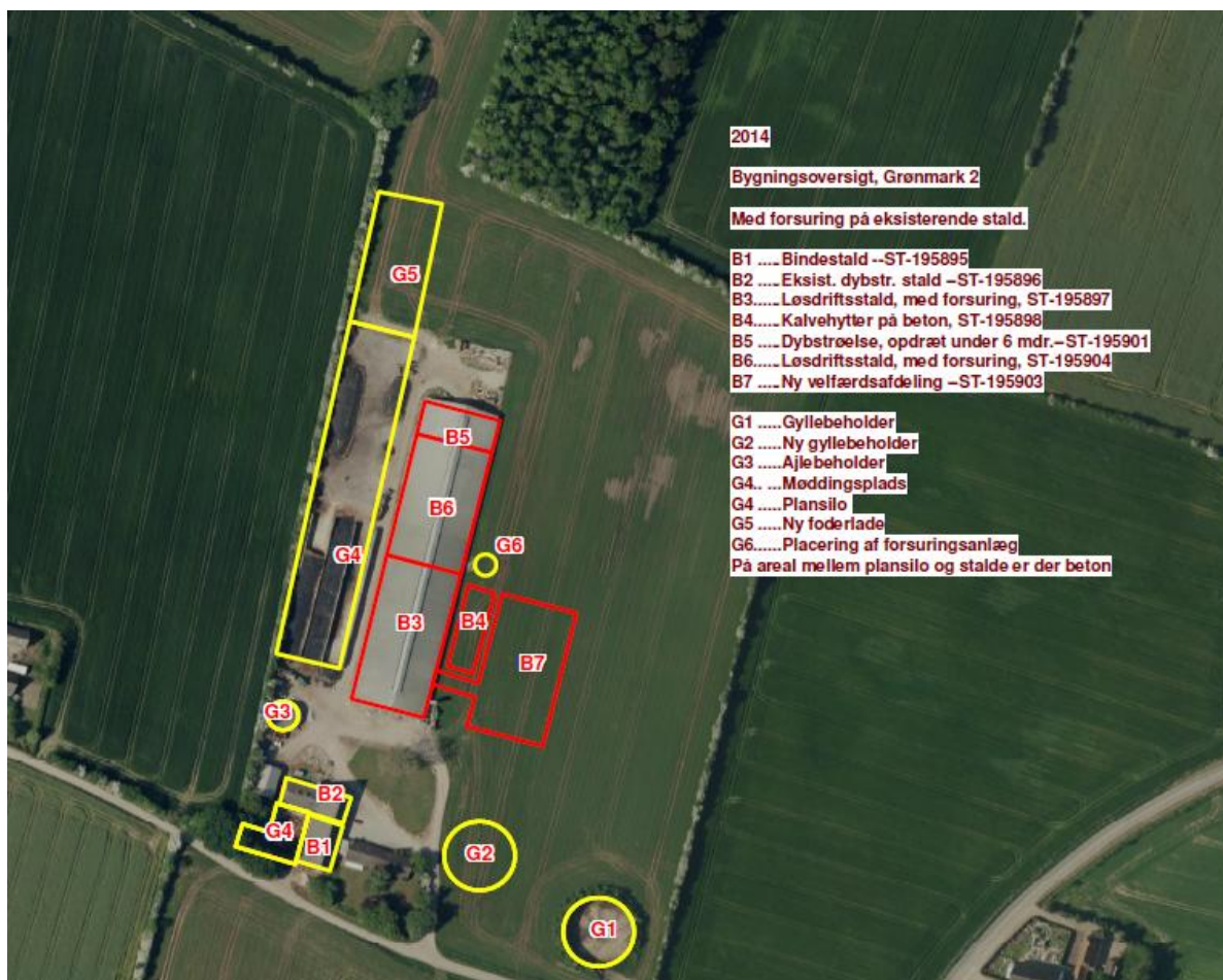
Figur 3: Eksisterende og nye bygninger. De nye bygninger etableres i etape 1.

Bygning B7 får en anden størrelse end i den oprindelige godkendelse. Størrelsen fremgår af tabel 1. Øvrige bygninger bliver som i miljøgodkendelsen.