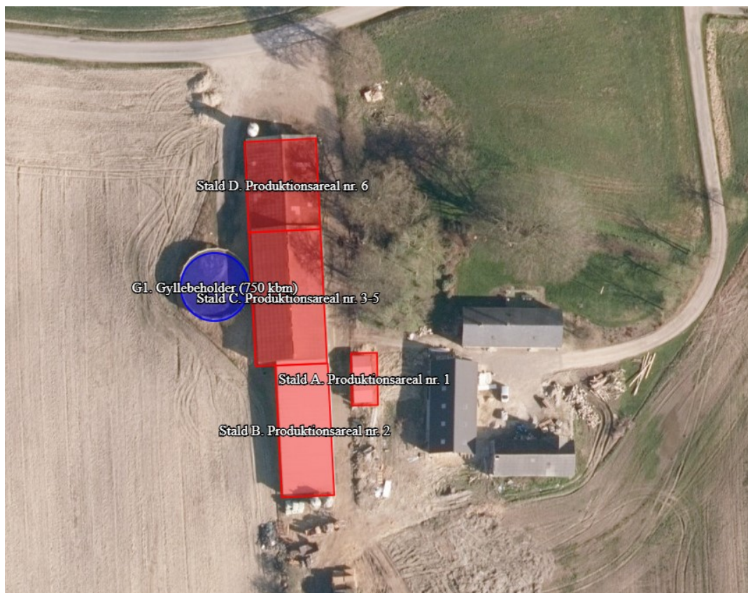
Figur 1: Oversigt over produktionsareal og dyrenes placering på Brunsegyden 5, 5690 Tommerup.

Der er søgt om miljøtilladelse til det eksisterende produktionsareal og nye kalvehytter på Brunsegyden 5, 5690 Tommerup.