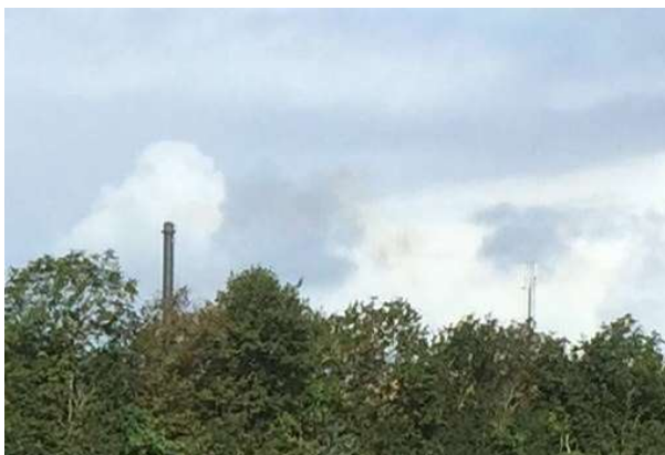
Billede af røg fra skorsten taget fra vejen mellem Adelvej nr. 13 og Flensted – røgen ser grå/brunlig ud.