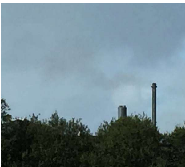
Billede af røg fra skorsten set fra grusvej op mod Adelvej nr. 13 – røgen ser grå/brunlig ud.