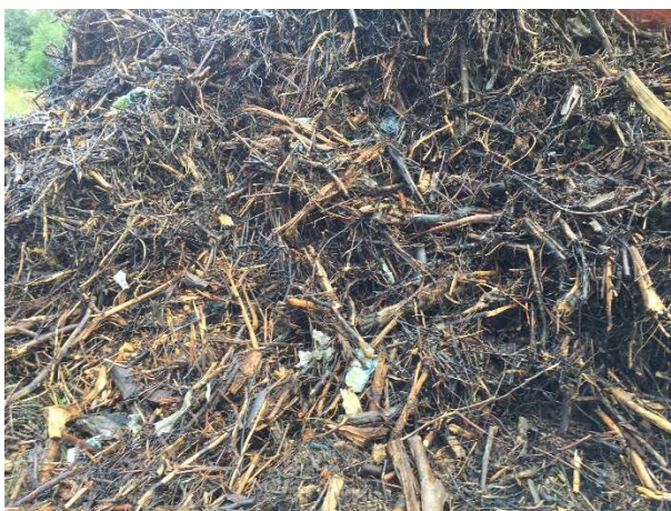
Urenheder i oplagret flis – placeret udendørs.

Ved tilsynet blev det konstateret, at den flis, som Flensted anvender i fyringsanlægget indeholder urenheder i form af blandt andet plastik.