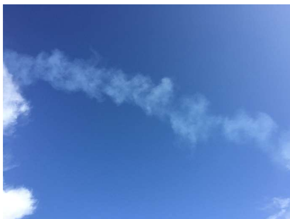
Billede af røg taget ved Flensted til sidst ved tilsynet.