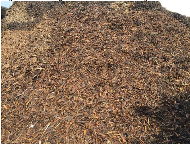
Neddelt flis, som anvendes i fyringsanlægget – placeret udendørs.