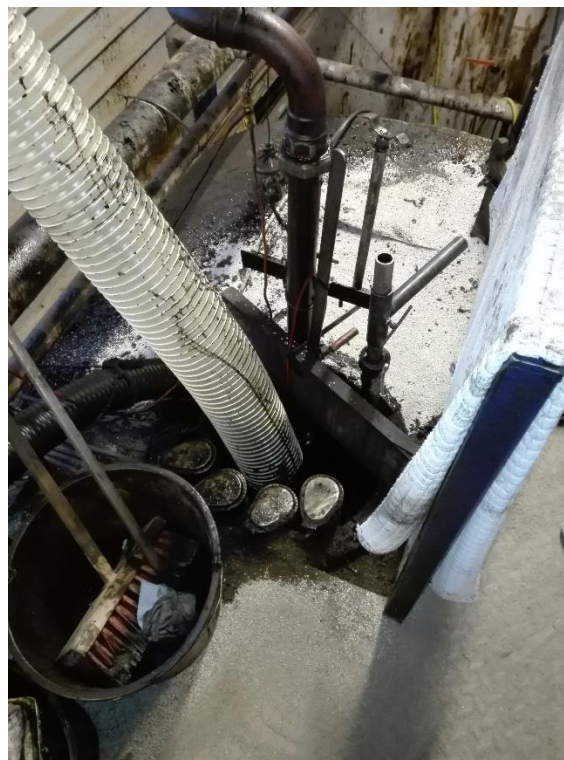
Hul med overfyldningsalarm, der går til telefoner.