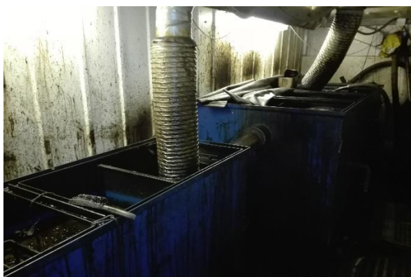
Olieudskillere. Slanger er til udsugning.