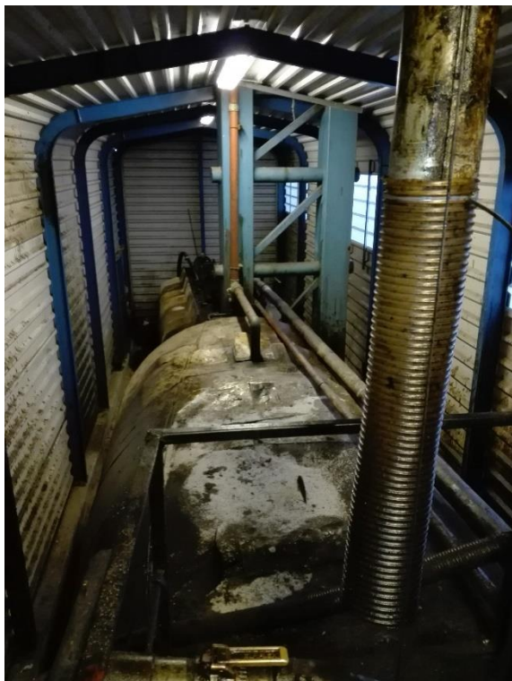
50 m3 modtagetank forrest, 17 m3 tank til oliefasen bagved.