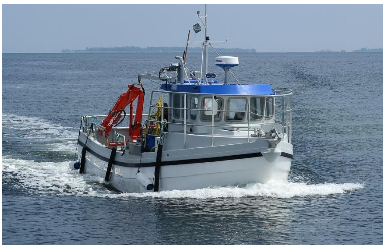
Figur 2 Båd anvendt ved tilsynet 30. august 2018 "Alba AquaPri"