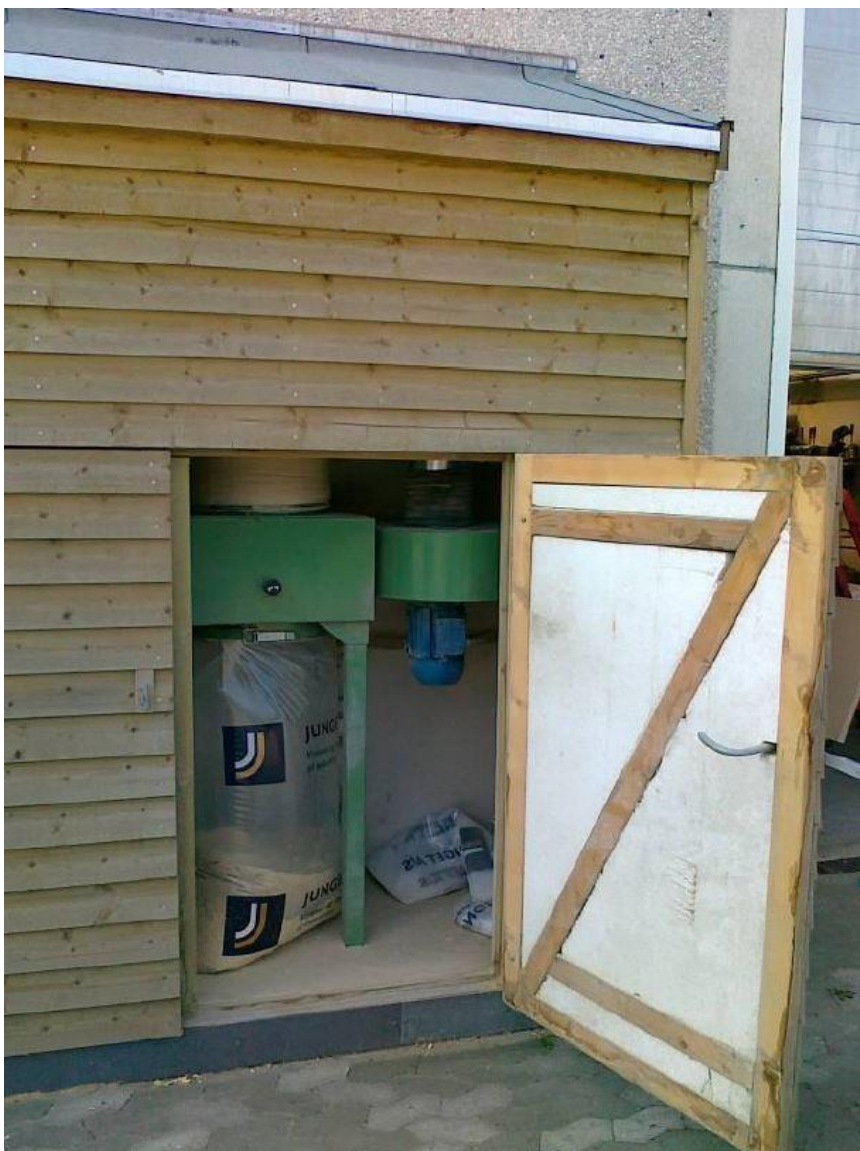
Filteranlæg på spånsugning er etableret i støjdæpende skur.