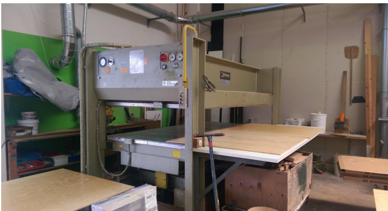
Maskiner på snedkeriet