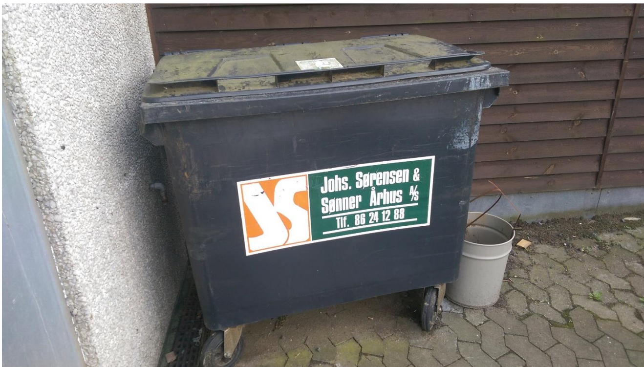
Container til blandet brændbart affald.