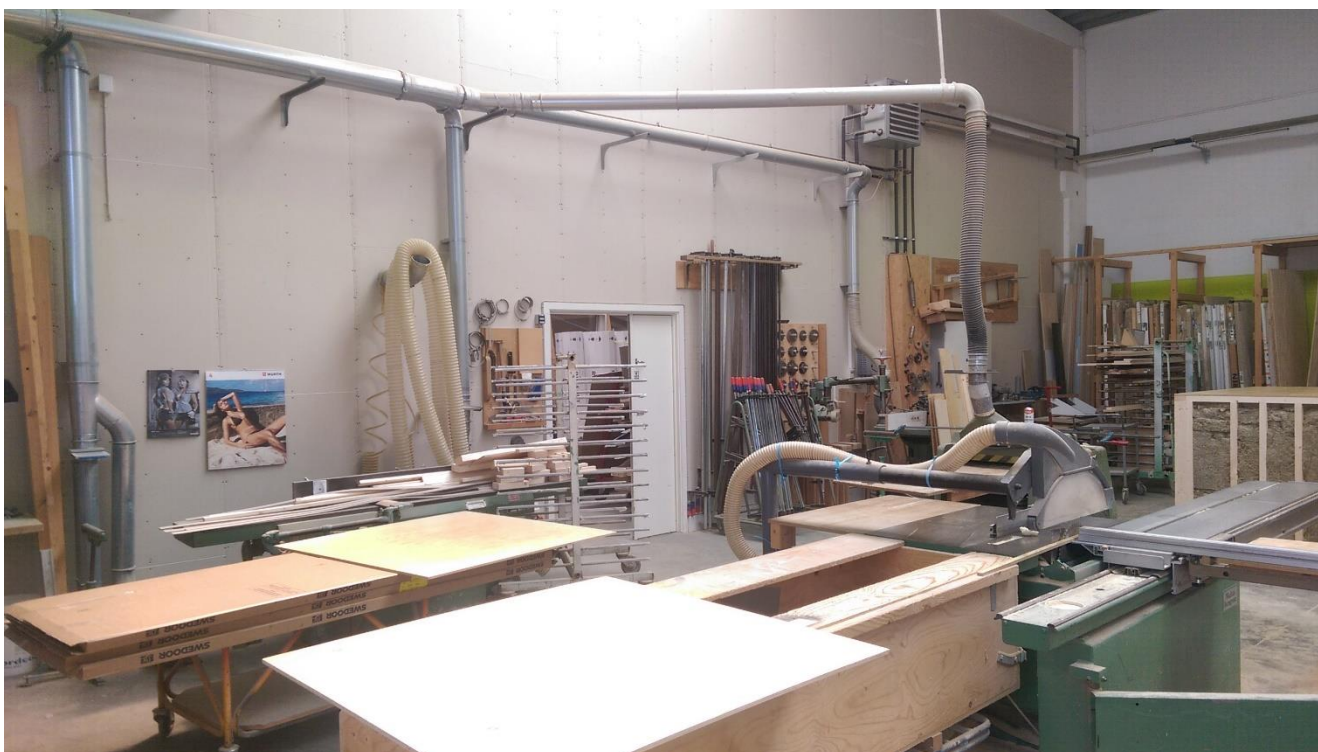
Maskiner på snedkeriet