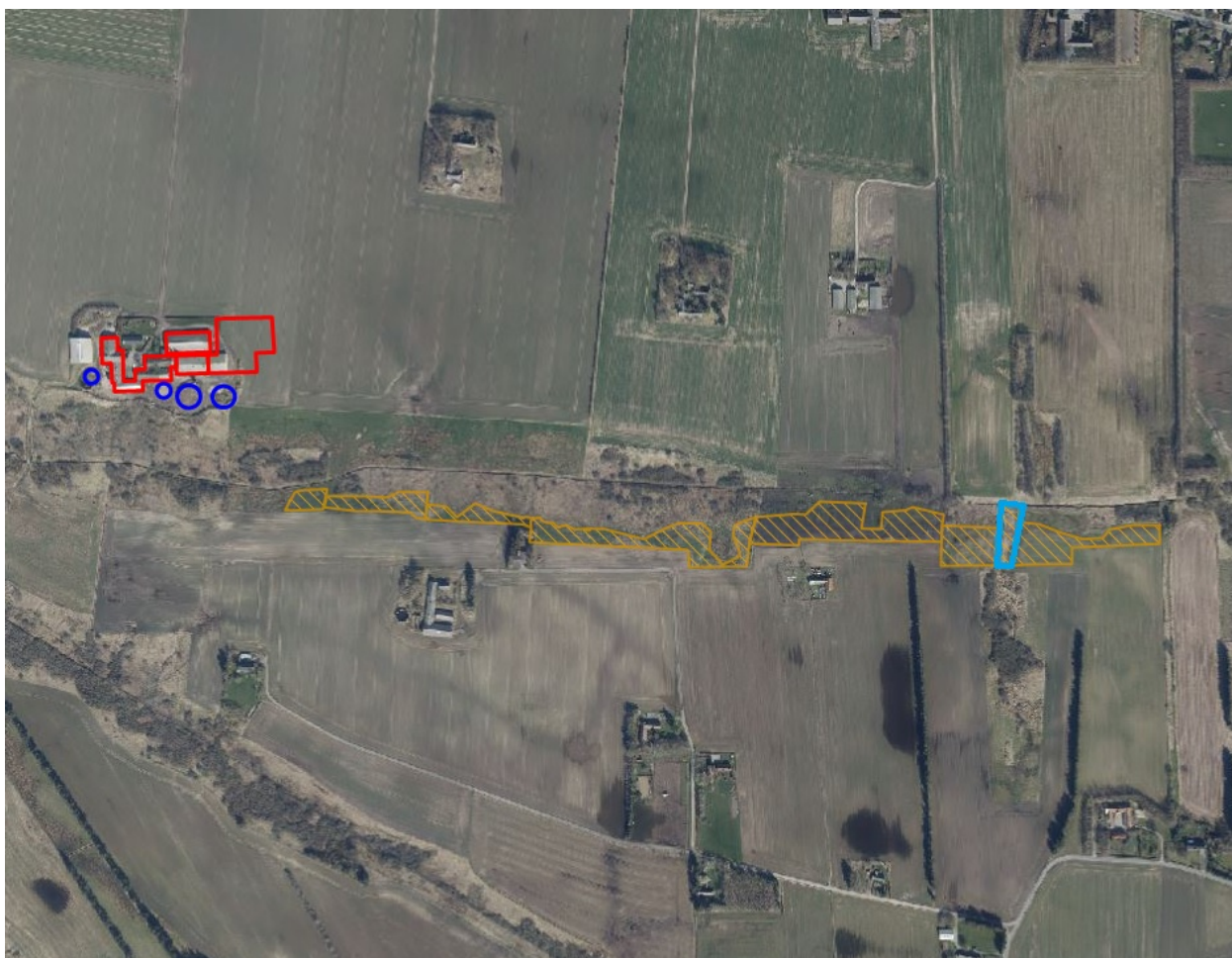
Registreringer af natur i ådalen syd for husdyrbruget. Brun skravering viser overdrev, mens blå indtegning viser et område, som fejlagtigt var angivet som overdrev, men i virkeligheden var mose.

størrelse i forhold til husdyrlovens §7 6 og dermed kategori 2 natur. I denne sammenhæng kan arealerne af adskilte overdrev IKKE tælles sammen, uanset om de er funktionelt sammenhængende eller ej.