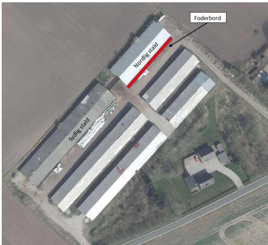
Situationsplan over Favrskovvej 8B. Foderbordet er markeret med rødt.