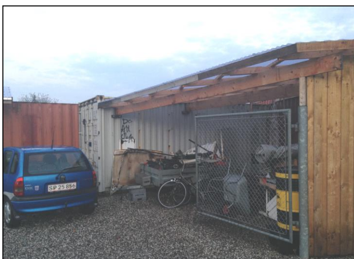
Foto af affaldsområde