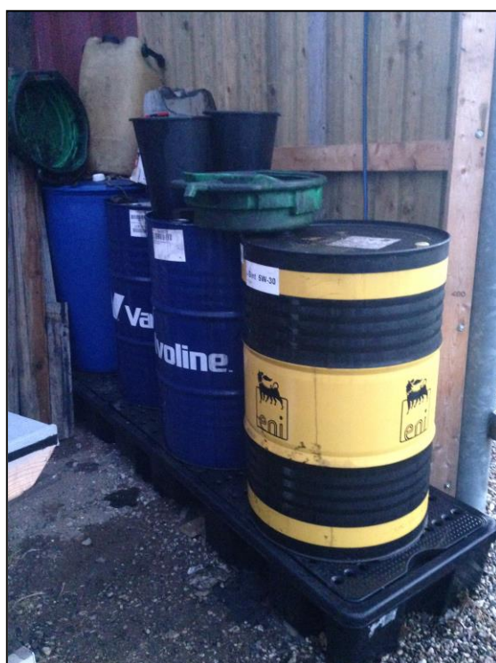
Foto af opbevaring af spildolietromler på miljøri-

Opbevaring af spildolie opfylder nu §13 stk. 1 med opsamlingsbassin