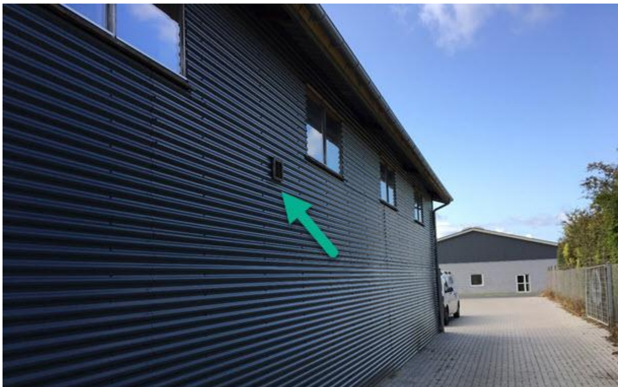
Billede taget langs med bygningen ved Priorsvej. På billedet ses afkastet fra udsugning, der går ud gennem siden af bygningen.