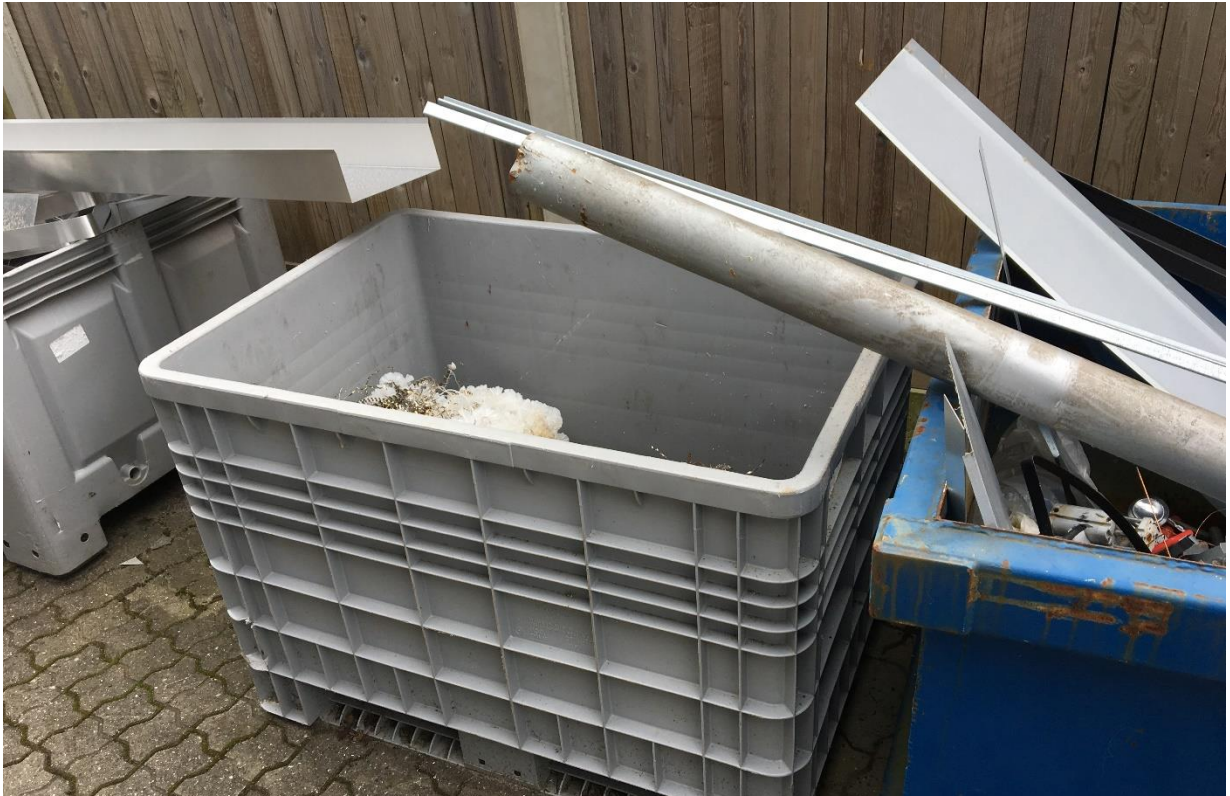
Billede af den lille container hvori spåner, der kan indeholde olie opbevares.