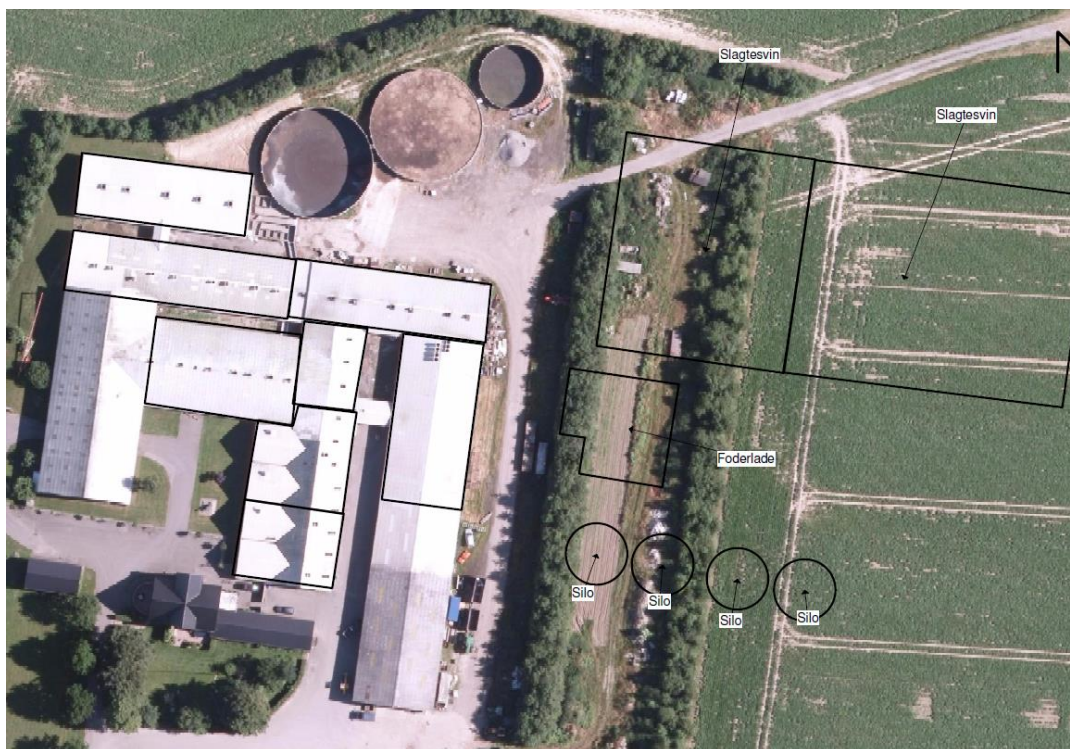
Kort fremsendt af anmelder. Foderladen og de 2 stalde er etableret.

Siloerne er anmeldt til at ligge mellem 15 m og 50 m fra eksisterende foderlade og staldanlæg, og i umiddelbar forlængelse af hinanden med en indbyrdes afstand på maksimalt 3 m. De er oplyst til at blive 14,0 m høje (totalhøjde) med en diameter på 16,4 m.