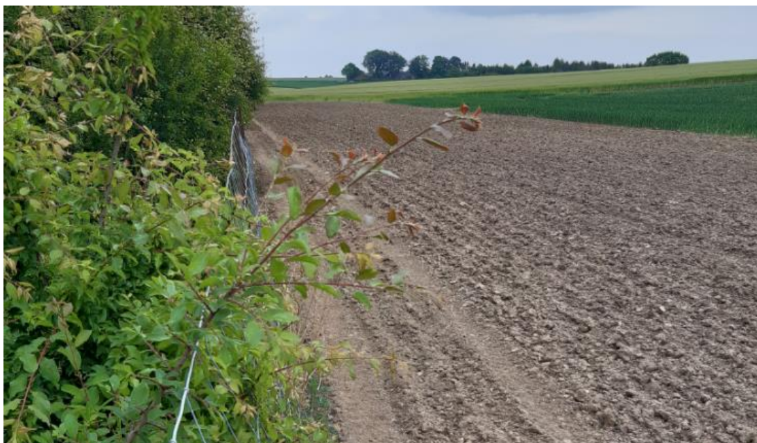
Billede 5. Mark sydvest for lossepladsen.

Odder Kommune fik i marts 2017 målt gasemission fra deponiet med henblik på at få del i Miljøstyrelsens tilskud til biocoverprojekter. Målingen viste, at der var for lidt gas i pladsen til, at Odder Kommune kunne få tilskud til etablering af biocover.