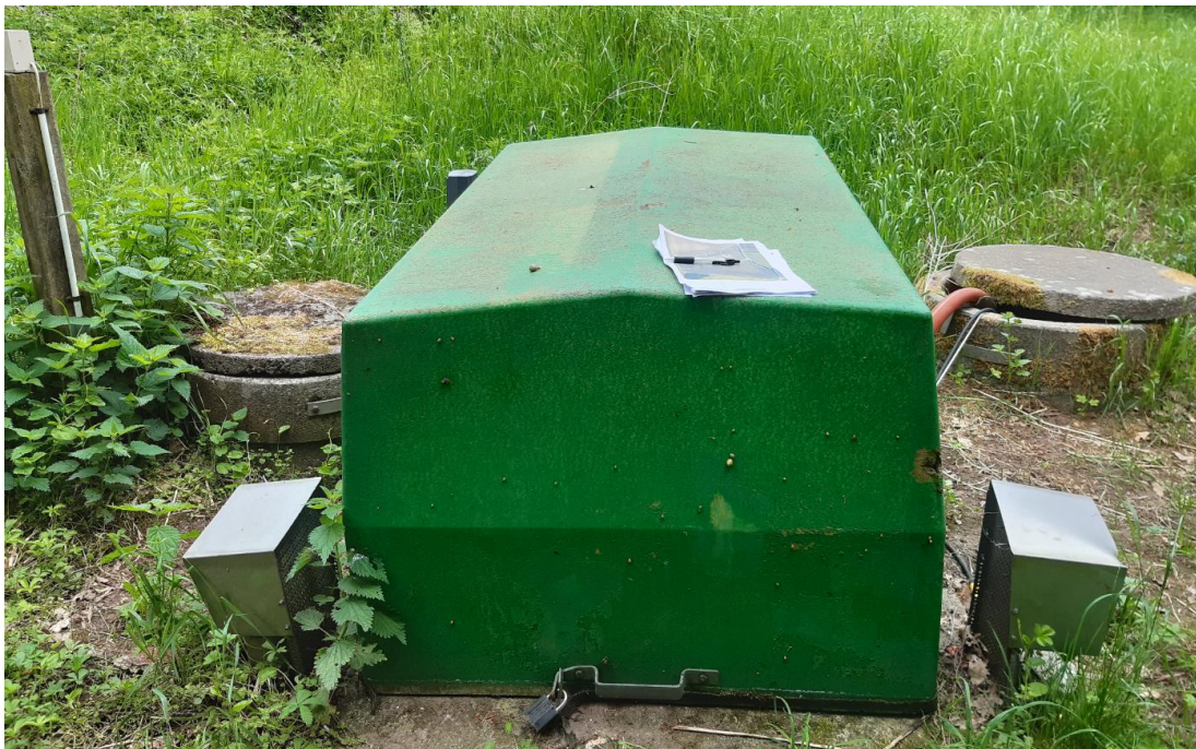
Billede 4. Perkolatpumpe med tilhørende anlæg.

Lossepladsen er forsynet med dræn over og under bundmembran. Perkolat pumpes til renseanlæg. Drift af perkolatpumpe m.m., se Billede 4, varetages af Samn Forsyning ApS.