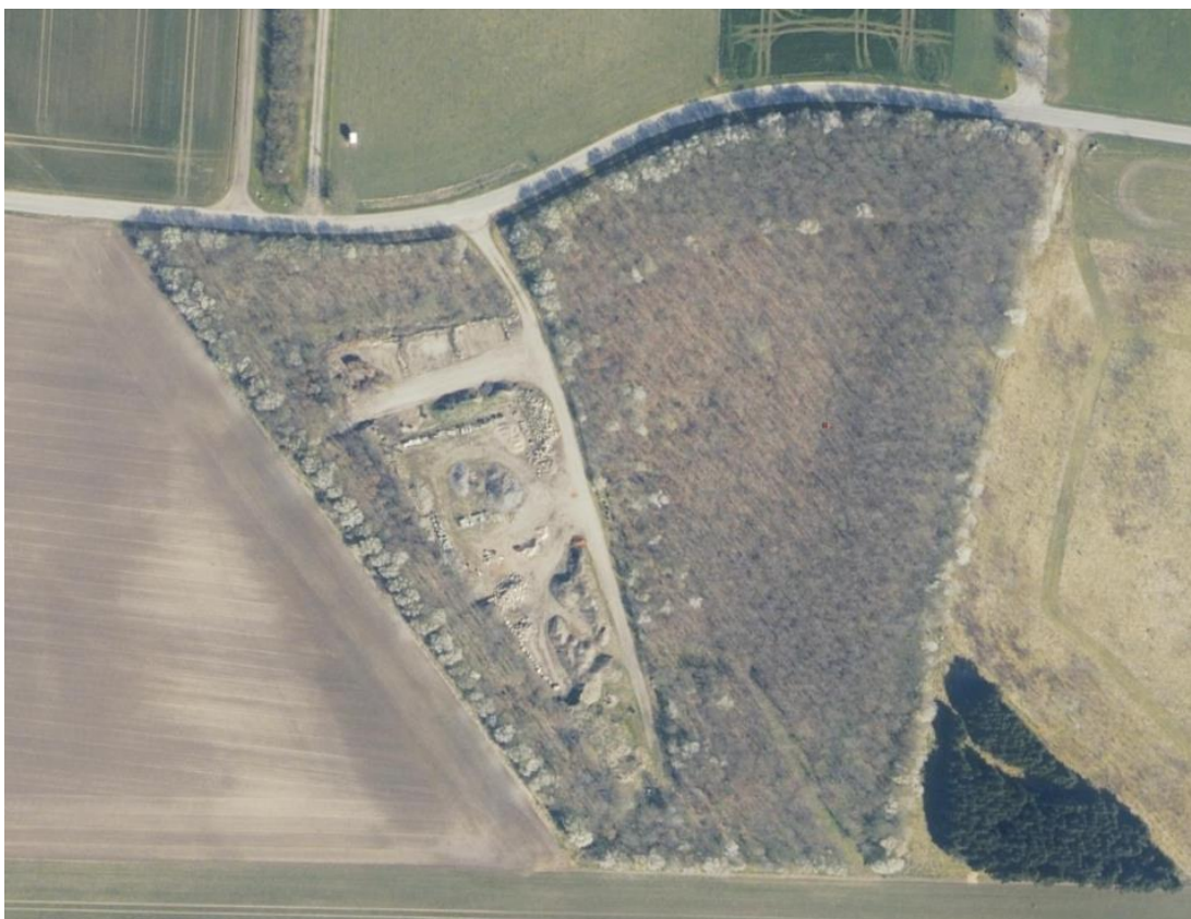
Billede 1. Luftfoto 2023.