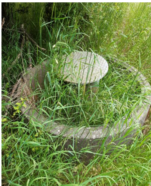
Billede 13. Monitoringsboring FB1, DGU-nr. 108.178.