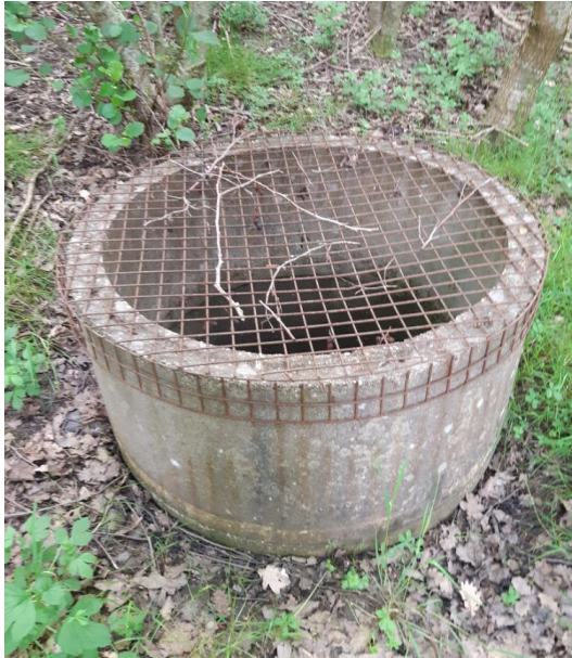
Billede 8. Gasbrønd – samme brønd som Billede 9.