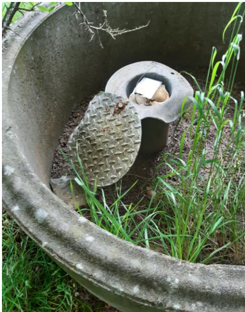
Billede 10. Monitoringsboring FB5, DGU-nr. 99.522.

Tre af fire monitoringsboringer blev besigtiget udvendigt og en boring blev åbnet, se Billede 10, Billede 11, Billede 12 og Billede 13.