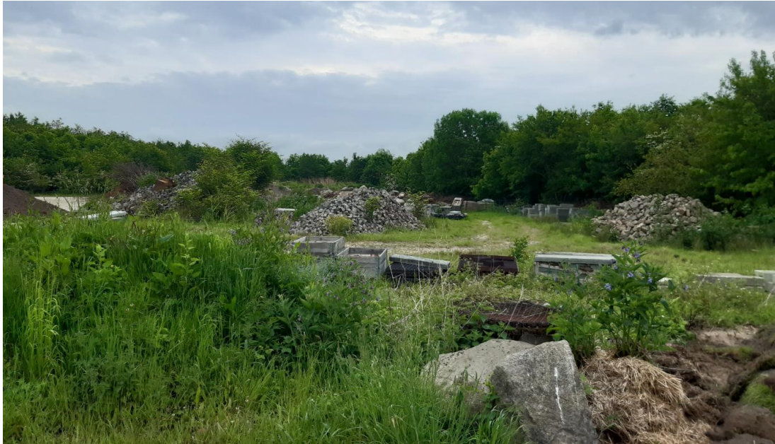
Billede 3. Udsnit af oplagsplads.