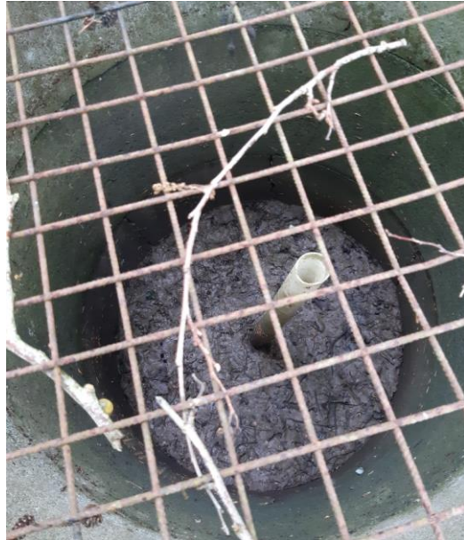
Billede 9. Gasbrønd uden vand – samme brønd som Billede 8.