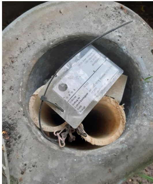
Billede 11. Monitoringsboring FB5, DGU-nr. 99.522.