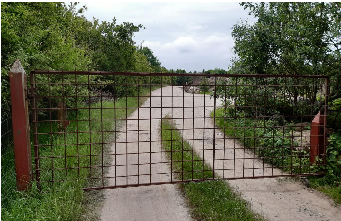
Billede 2. Port i indkørsel.

Odder Kommune, Vej & Park, har af oplag af grenaffald, jord, sten, grus og sand på den ikke-beplantede del af lossepladsen, se Billede 3. Oplagsaktiviteten er reguleret af miljøgodkendelse af 3. august 1995. Godkendelsen er meddelt til oplag af natursten, ren lerjord, rabatjord, flis og grenaffald. Der må ikke forekomme flishugning eller anden bearbejdning på pladsen.