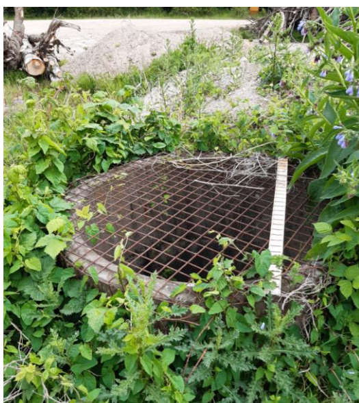
Billede 6. Gasbrønd - samme brønd som Billede 7.

Pladsen er forsynet med flere gasbrønde. Nogle af brøndene blev besigtiget under tilsynet. Der stod vand i nogle brønde, men ikke alle. Der var ingen lugt fra brøndene. Da der ikke står vand i alle brøndene, og der ikke er lugt, vurderes det umiddelbart, vandet er regnvand, der støver op i gasbrøndene. Aftalt på tilsynet, at kommunen undersøger eget arkiv for oplysninger om etablering og indretning af gasbrøndene.