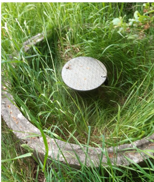
Billede 12. Monitoringsboring FB4, DGU-nr. 108.196.