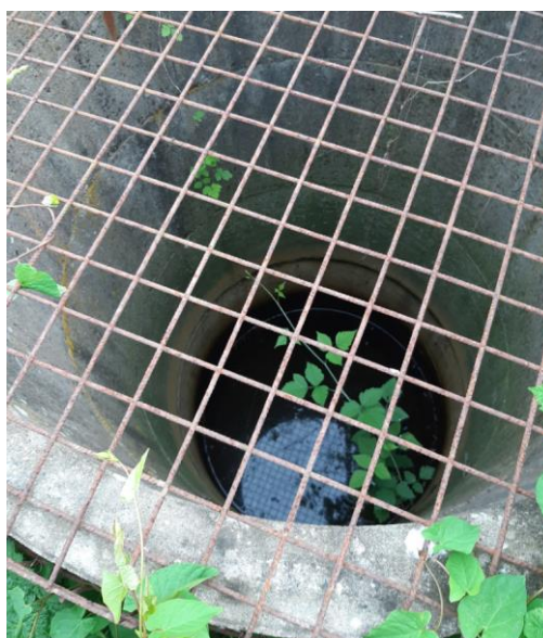
Billede 7. Gasbrønd med vand - samme brønd som Billede 6.