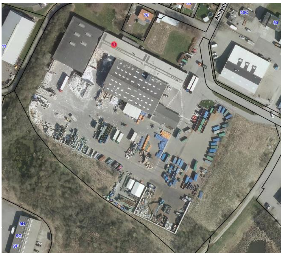
Fig. 1 Luftfoto af virksomheden anno 2018 med matrikelskel

Virksomheden ligger i rammeområde 250602ER. For området gælder endvidere Lokalplan 379 - Erhvervsområdevest fro Anelystvej mellem True og Viborgvej. I kommuneplanen er området udlagt til erhverv i virksomhedsklasse 2-6. Virksomheden indplaceret i virksomhedsklasse 6.