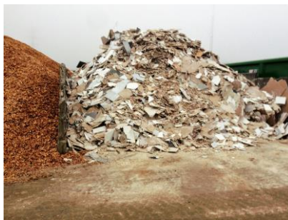
Oplag af gipsaffald