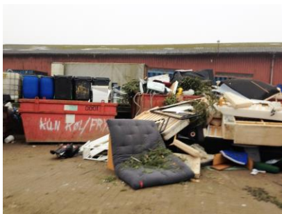
Blandet brændbart affald

Ved tilsynet kunne det konstateres at virksomheden har etableret udendørs oplag af affald af affaldstyper (gipsaffald, metalaffald, blandet brændbart affald og oplag af sanitære installationer), som virksomheden ikke har miljøgodkendelse til at opbevare og håndtere.