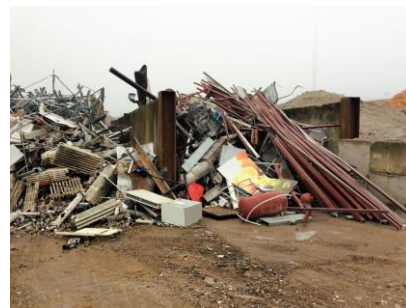
Oplag af metalaffald