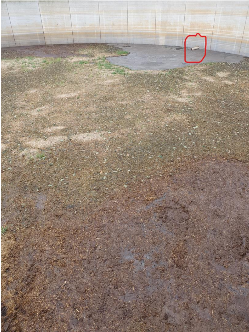
Gylletank fra 2002, vandret indløb angivet med rødt.