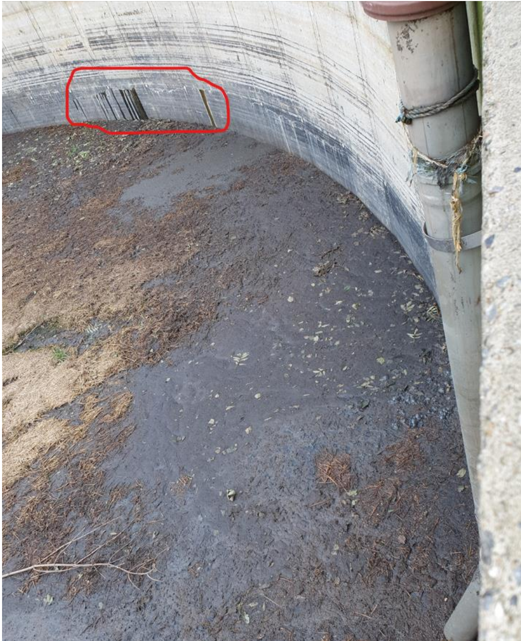
Gylletank fra 1989, eksempler på indtrængende grundvand er markeret med rødt.