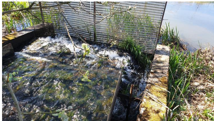
Foto: Gitter ved udløb

Vilkår 13 vedr. afgitring ved ind- og udløb: Der er afgitring på både ind- og udløb. OBS : På tilsynet kunne det ses at gitteret i den nordlige side af udløbet ikke dækkede tilstrækkeligt. Det blev oplyst at det formentlig var en skade der var opstået i forbindelse med et væltet træ under en storm. I skal hurtigst muligt reparere gitteret så vilkåret overholdes.