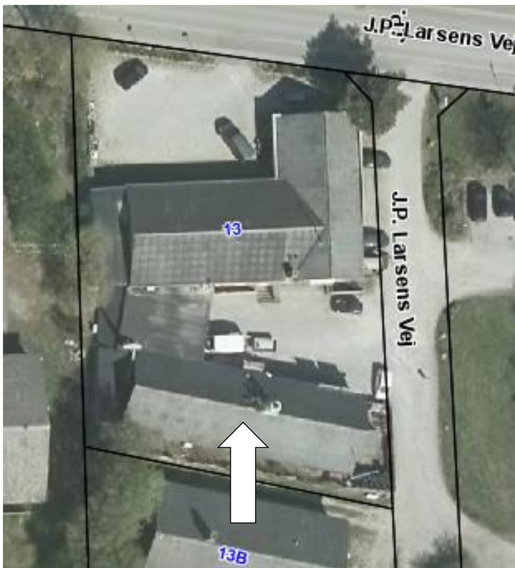
Luftfoto af ejendommen med matrikelskel anno 2019

I forhold til kommuneplanen ligger virksomheden i område 240308, der er udlagt til erhverv. Der kan etableres en bolig i tilknytning til den enkelte virksomhed. Nærmeste bolig ligger i en afstand af ca. 50 meter. Virksomheden er indrettet i bygningen mod syd (se pil) på luftfoto.