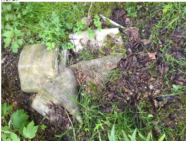
Rest af gulvtæppe? Bag ved fabrik mod nord.

Affaldet udenfor fabrikken var ikke bortskaffet ved dette tilsyn. Fristen for indskærpelsen var den 23. november 2020 og for indsendelse af kvitteringer den 21. december 2020 . Denne er ikke efterkommet.