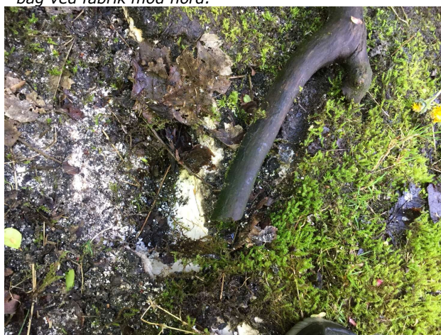
Lag med fedt på grunden - delvist skjult af bevoksning. Så ud til, at der kunne være gnavet af det. Bag ved