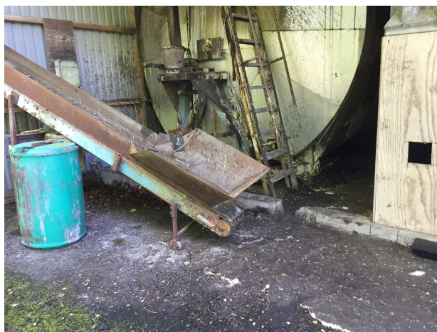
Fedtaflejringer på jordoverfladen + rottefælde - bag ved fabrik mod nord.