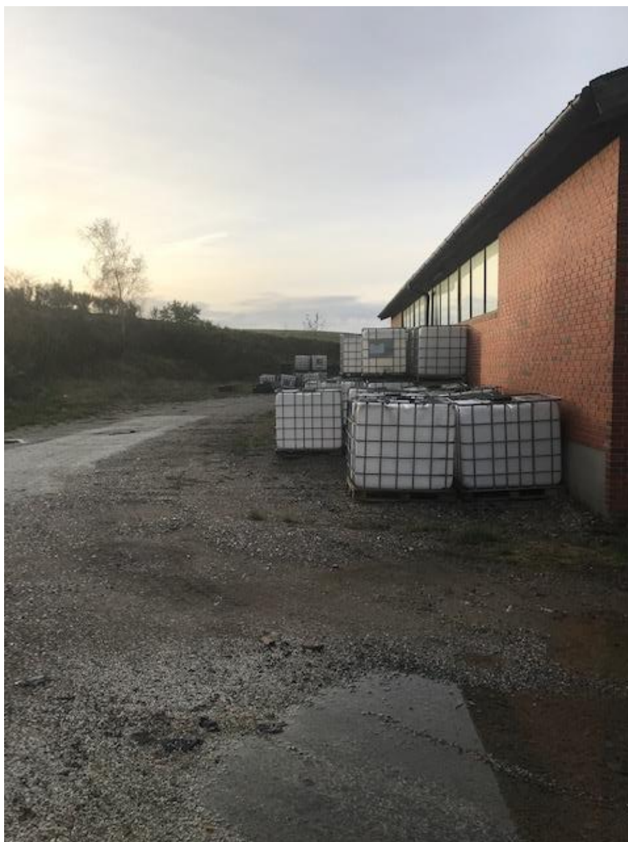
Billede 1. Opbevaring af palletanke bagved bygning.

Det er værd at undersøge priserne, idet nogle modtagere giver penge for metallet og andre tager penge for at tage det.