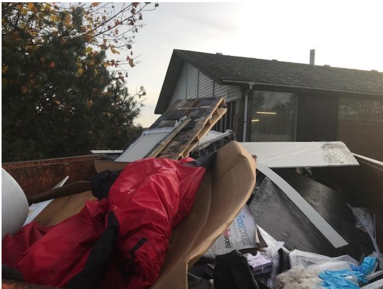
Billede 2. Container med brændbar affald indholdende pap, papir, hård plastic, blød plastic, træ, træfiner, tøj m.v.

Ved tilsynet blev der endvidere observeret, at virksomheden ikke kilde sorterer deres affald. Der blev observeret en container indholdende pap, papir, hård plastic, blød plastic, træ, træfiner, tøj m.v., se billede 2. Brian Rasmusen fortalte ved tilsynet at affaldet bliver bortskaffet som brændbart affald.