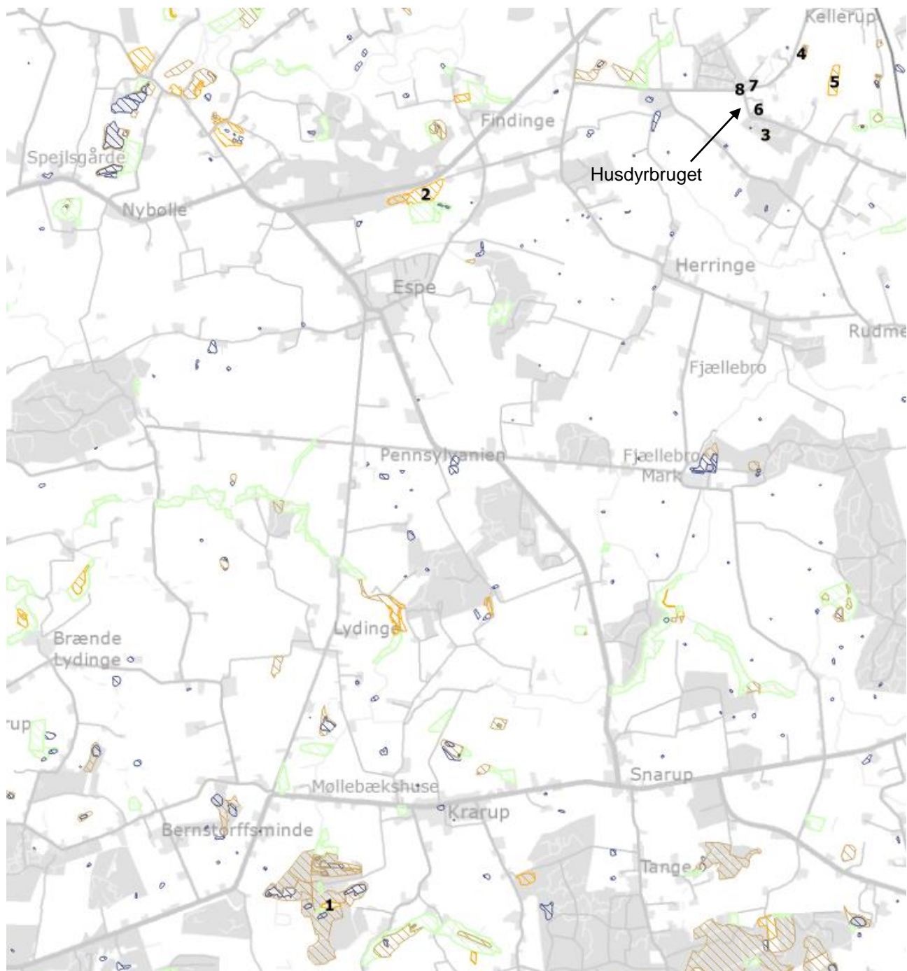
Figur 3.1. Markering af naturpunkterne

På figur 3.1 er naturpunkternes placering vist. Nummereringen henviser til nummeret i tabel 3.5