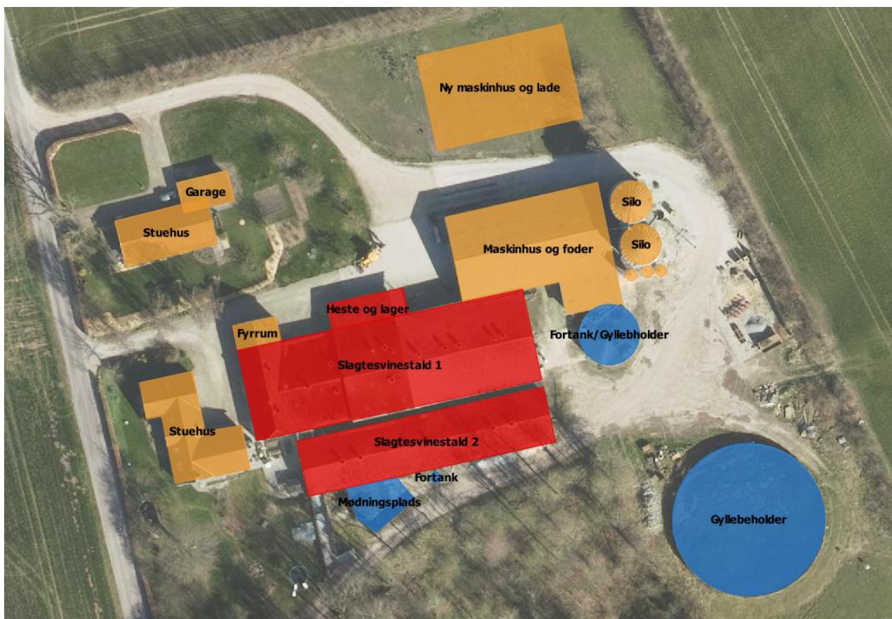
Figur 2.2. Oversigtskort over husdyrbrugets staldanlæg.

Staldene til svin er med mekanisk ventilation, mens stalden til heste er med naturlig ventilation.