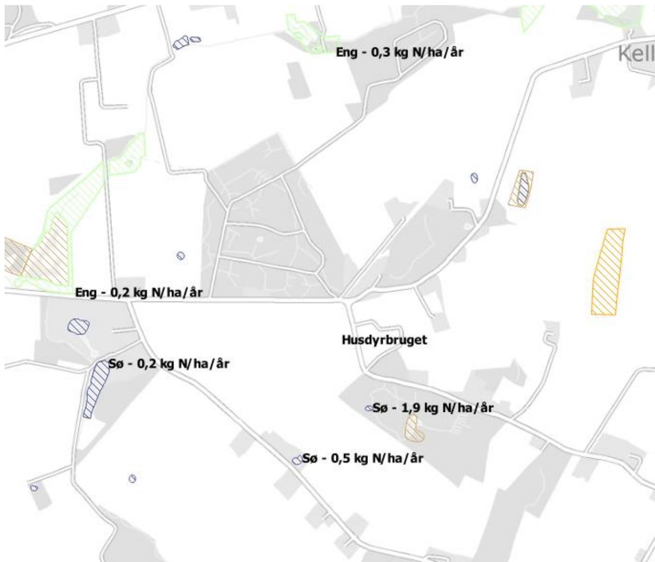
Figur 3.2. Markering af § 3 naturpunkterne med den beregnede totaldeposition.

De omkringliggende vandhuller er af ringe eller ingen naturkvalitet og de modtager et ikke ubetydeligt kvælstofbidrag fra de omkringliggende dyrkede marker. Da der heller ikke her er tale om en merdeposition vurderer Faaborg-Midtfyn Kommune, at husdyrbruget ikke vil påvirke søerne yderligere.