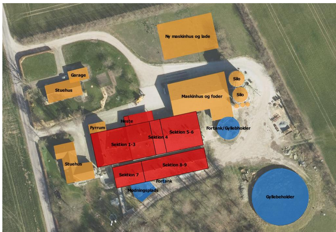
Figur 2.3. Oversigtskort med indtegning af staldenes sektioner

Ejendommen har ikke ændret sig indenfor de seneste 8 år. Der er derfor ikke forskel på ansøgt drift, nudrift og 8-årsdrift.