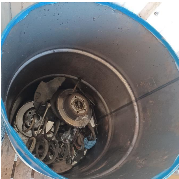
Bøtte til metal

Vedhæftet tilsynsnotatet er en liste over dækindsamlingsvirksomheder, som er godkendt i Region Hovedstaden. Du kan fx prøve Høyer og Partner eller en af de andre. Dækindsamlere får tilskud til indsamlingen. Derfor burde det være meget billigt at få hentet dæk. Tilskuddet er i 2024 på 1,66 kr. pr. kg dæk.