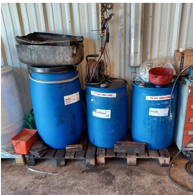
De forskellige fraktioner til Stena Miljø