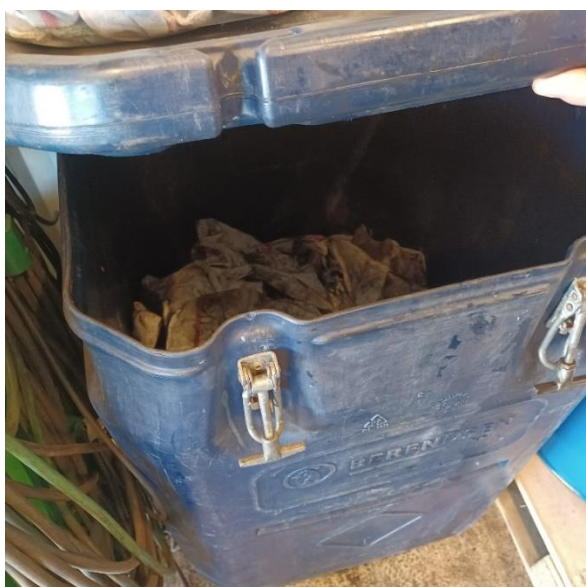
Til brugte klude.