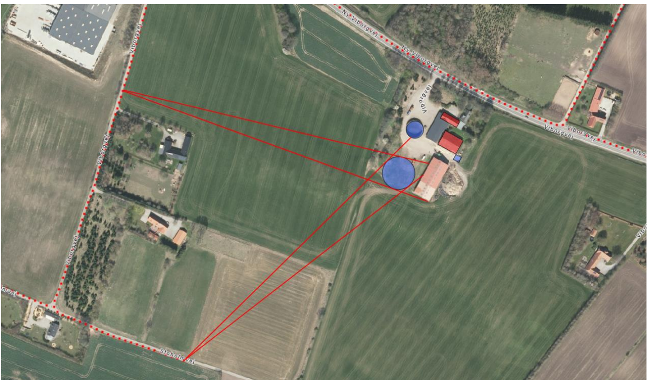
Kiggelinjer til de sidste 2 gadefotos