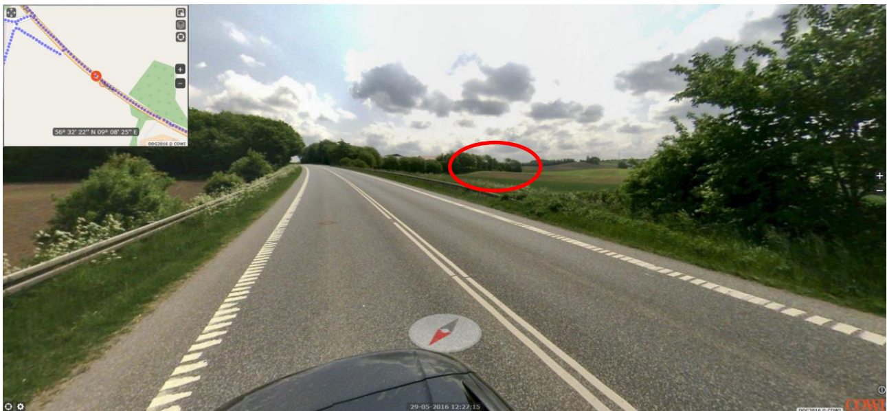
Ejendommen set fra Viborgvej, køreretning mod øst

Ejendommen ligger udenfor uforstyrret landskaber og udenfor bevaringsværdige landskaber.