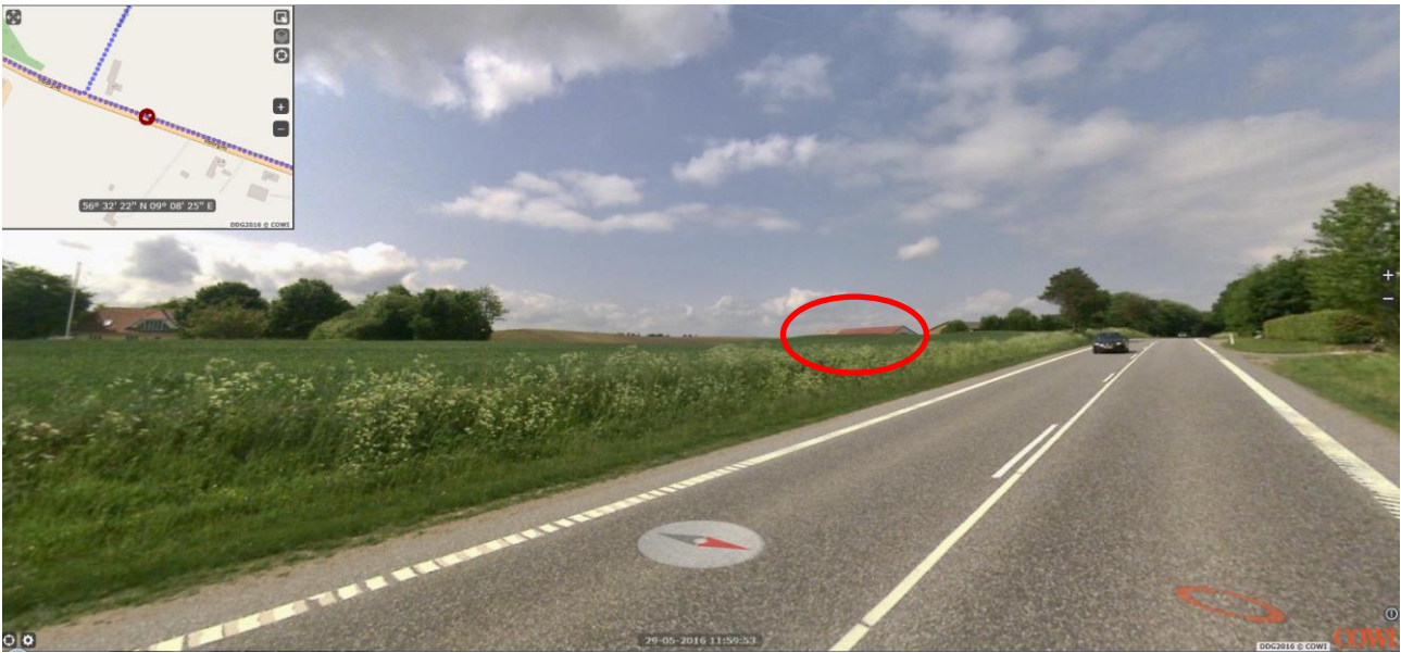
Ejendommen set fra Viborgvej, køreretning mod vest