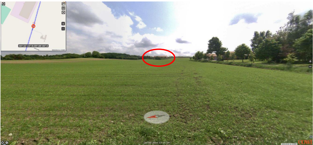
Ejendommen set fra Viborgvej (mellem Ny Viborgvej og Stoholmvej)