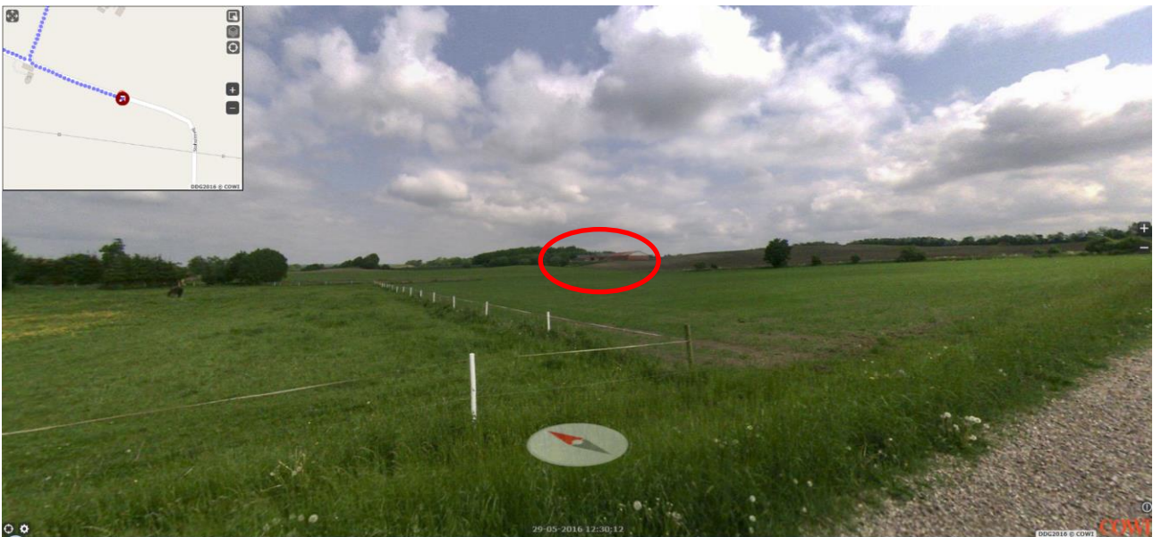
Ejendommen set fra Stoholmvej