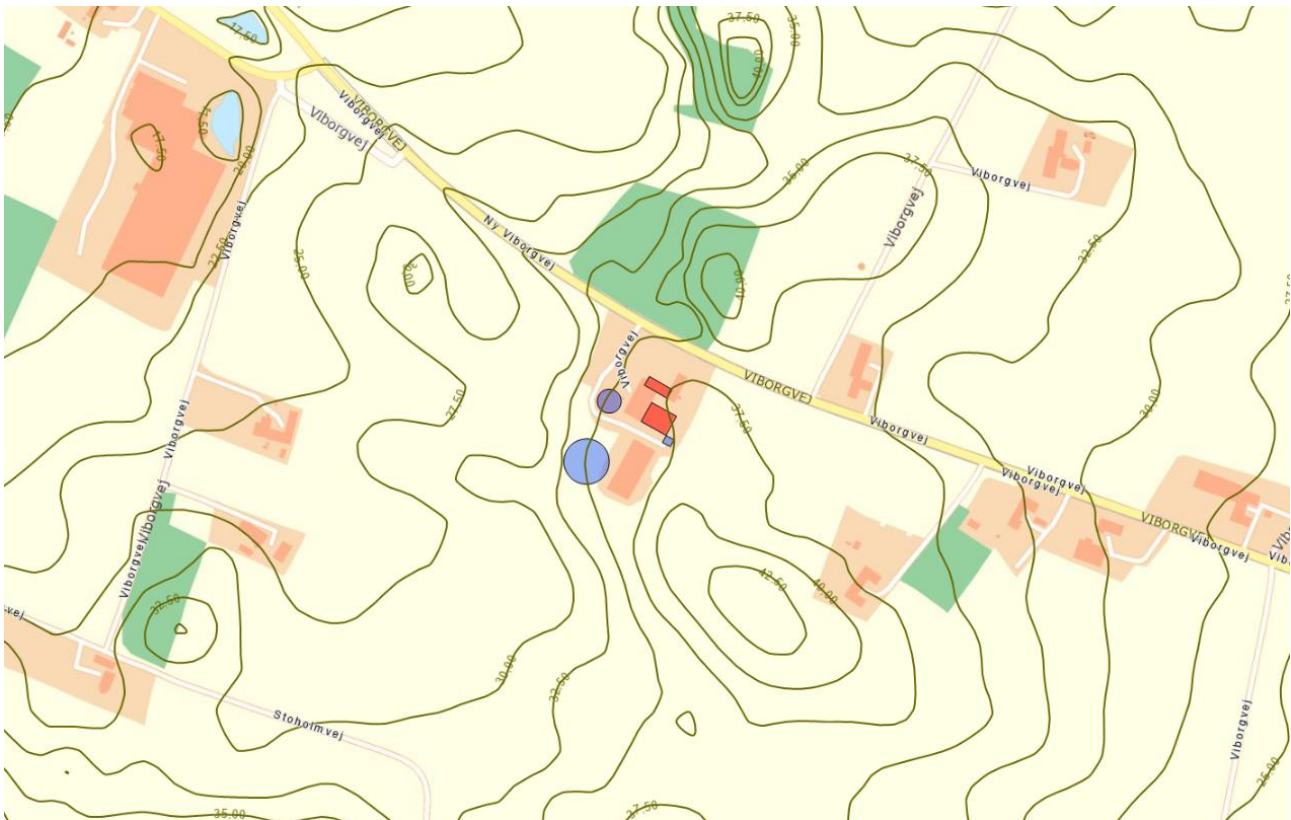
Højdekurver omkring husdyrbruget

Ejendommen ligger højt i landskabet og gyllebeholderen er relativ stor i forhold til landbrugsejendommens øvrige bygninger. Ud fra forudgående billeder og kort ses det, at det især er fra vest, sydvest og syd at beholderen vil være synlig. For at undgå at beholderne kommer til at virke alt for dominerende i landskabet stilles der vilkår om maksimal total højde på 8 m, vilkår om materialevalg, samt vilkår om beplantning. Skive Kommune vurderer, at landskabet med disse vilkår ikke påvirkes væsentlig af opførelsen af den nye gyllebeholder.