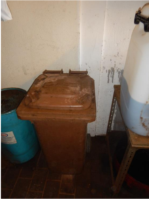
11. Beholder til brugt kattegrus.