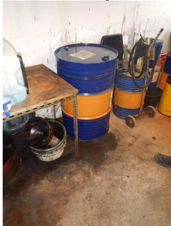
8. Tønde til spildolie.