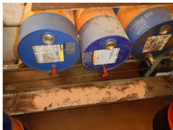
10. Tønder med spildrende og kattegrus.