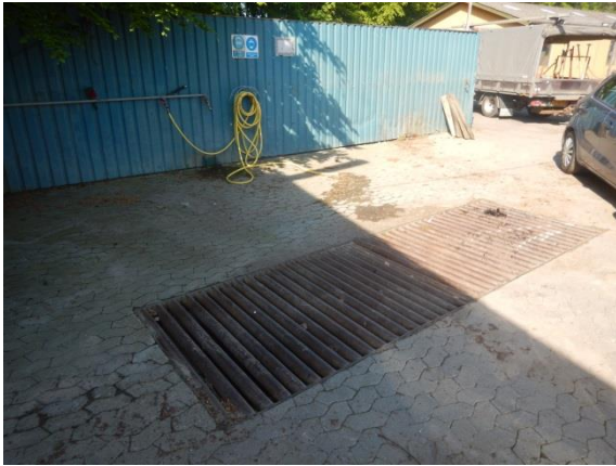
1. Vaskeplads med olieudskiller.