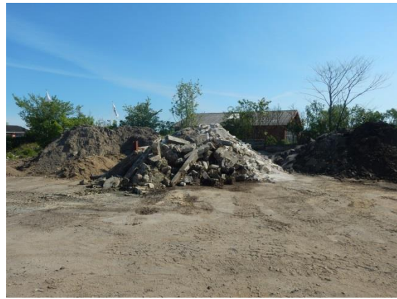
6. Beton til nedknusning.