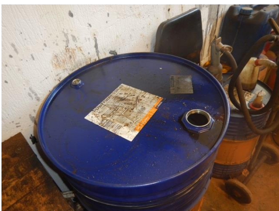
9. Tønde til spildolie.