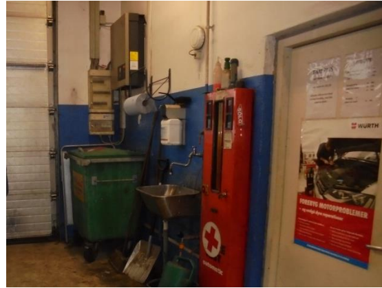
Container til blandet brændbart

Akkumulatorer returneres til FTZ, som del af en pantordning.