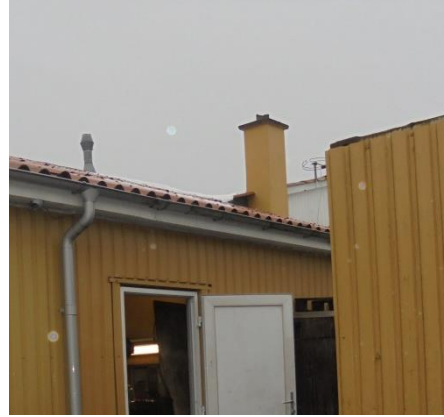
Afkast fra punktudsugning og pillefyr

Placeringen af de to afkast fremgår af vedlagte luftfoto.