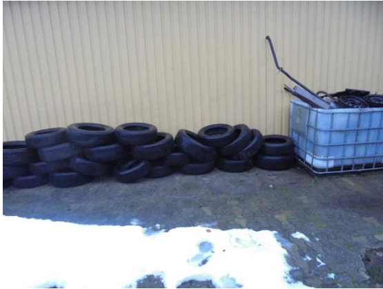
Oplag af dæk og metal