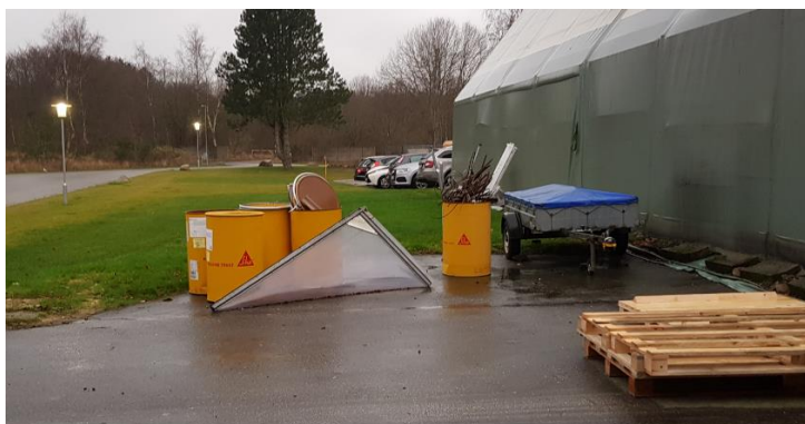
Opbevaring af jern og metalaffald

Jern- og metalaffald opbevares på paller/i kasser/tønder og bortskaffes til Sæby produkthandel der også indvejer affaldet efter affaldstype og indberetter det til det centrale affaldsregister på vegne af virksomhederne.