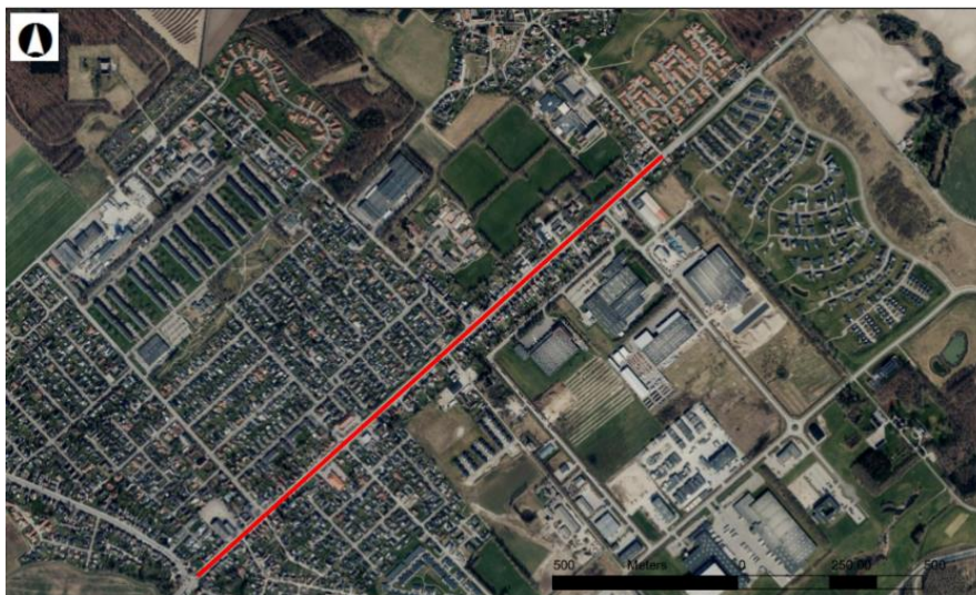
Figur 2-1 Den strækning af Roskildevej, der skal arbejdes på.

Roskildevej, matr. nr 7000a Benløse By, Benløse, strækningen er markeret på Figur 2-1.