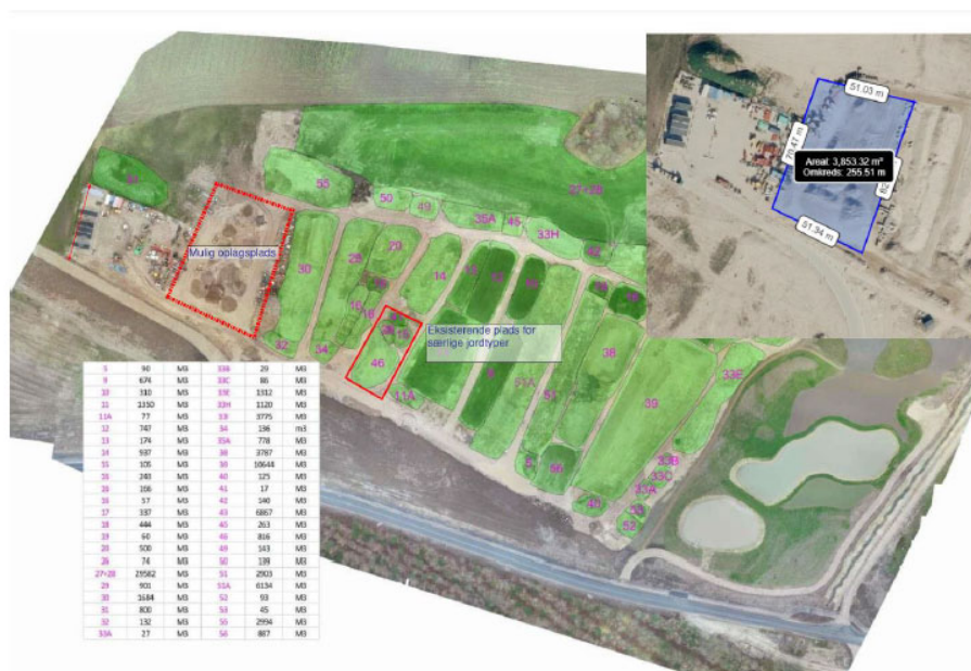
Figur 2 Planlagt område for midlertidig mellemdeponering

Området, hvor jorden ønskes placeret, fremgår af figur 2.